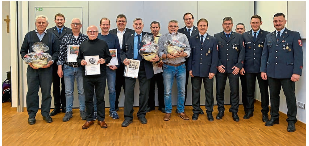
Mit Ehrungen und Beförderungen bei der Pichler Feuerwehr nahm das normale Vereinsleben wieder seinen Anfang.