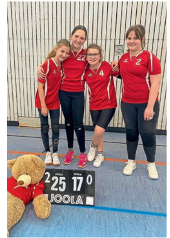
U13w II Mannschaftsfoto

Mit einem Heimspieltag um die Plätze 7 – 11 beendeten die Volleyballmädchen der U13w II die Saison 2023. Gegen den SC Freising fanden die Manchingerinnen zu Beginn aber nicht wirklich in ein gutes und stabiles Spiel und mussten beide Sätze abgeben. Gegen den TSV Neuburg konnten die MBB-Mädchen dann mit sicherem Aufbauspiel und einigen guten Blocks am Netz punkten und den ersten Satz gewinnen. Der 2. Satz ging gut los, aber Neuburg kämpfte sich immer wieder heran und lag gegen Ende des Satzes sogar in Führung. Manching wackelte und zitterte immer wieder, teilweise wegen Nervosität und Aufregung aber auch wegen einiger Missverständnisse bei der Feldabwehr. Trotzdem wurde der Neuburger Vorsprung mit einer tollen Angabenserie wettgemacht, und der 2. Satz mit solidem Vorsprung 25:18 gewonnen. Nach der Mittagspause fanden die MBB-Spielerinnen nicht ins Spiel und verloren den ersten Satz gegen die SG Moosburg. Der zweite Satz war ausgeglichener, die Führung wechselte regelmäßig und ein herausgespielter Vorsprung wurde