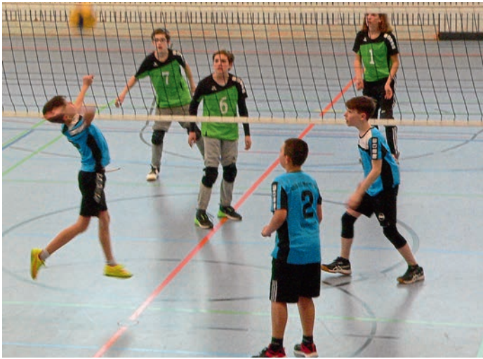
Spielezene der U13m gegen Obermenzing