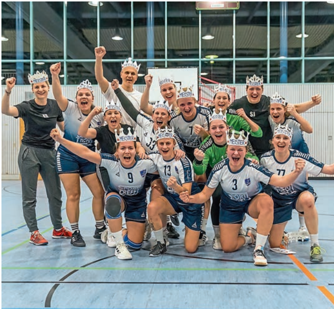
Krönten sich mit dem Meistertitel: Die 1. Damenmannschaft des HC Donau/Par.