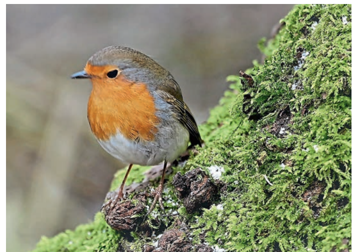
Zu Beginn der warmen Jahreszeit lassen sich Singvögel besonders gut beobachten wie das Rotkehlchen.