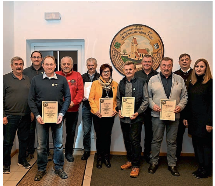
Nach drei Jahren Vereinsstille konnten wieder langjährige Mitglieder geehrt werden.