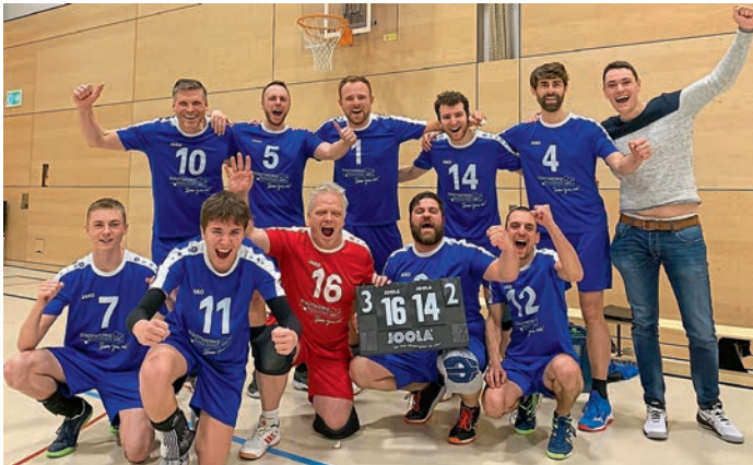
MBB-Herren beim Saisonfinale in Oberding