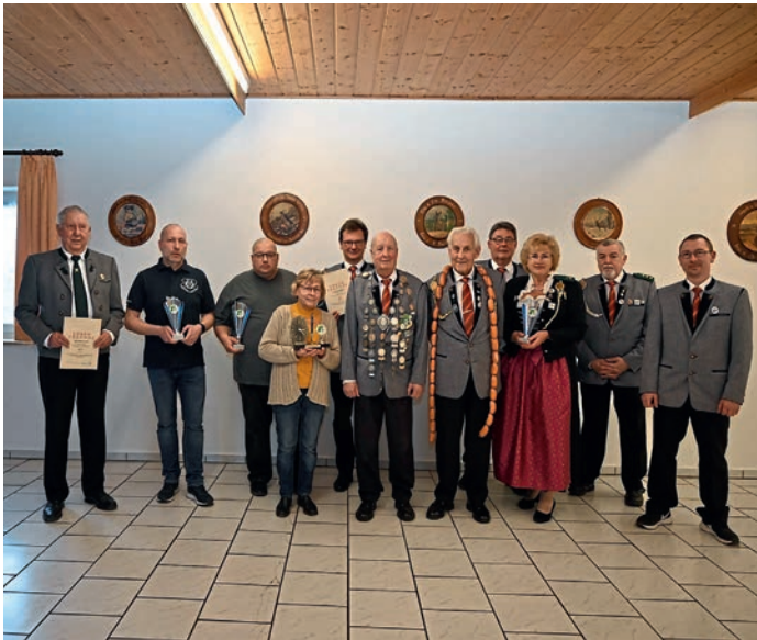
Ehrungen und die Königsproklamation aber leider ohne Jugend standen bei den Römerwallschützen auf dem Programm.