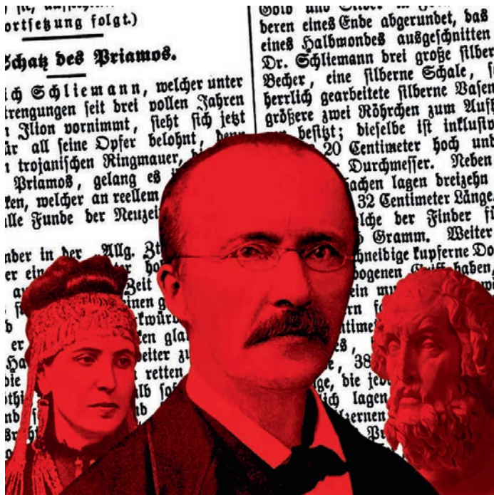
Sophia Schliemann, Heinrich Schliemann und der griechische Dichter Homer.