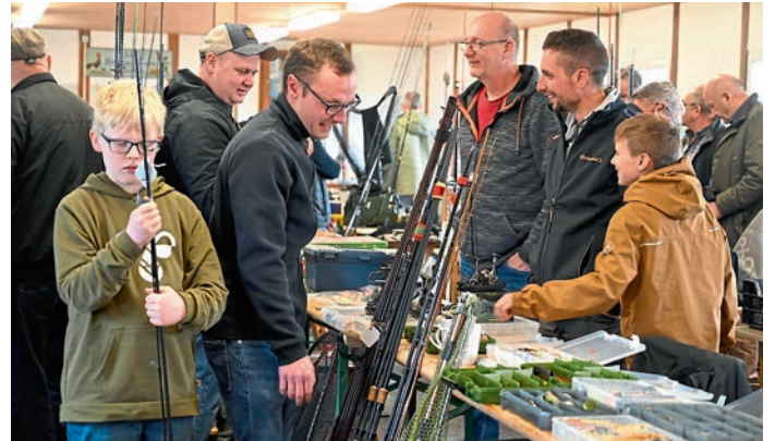
Tische voller Anglermaterial wurden am Anglerflohmarkt in Manching angeboten.

Alles was ein Fischerherz begehrt, wurde auf dem 12. Anglerflohmarkt, der einmal im Jahr stattfindet, in der Halle der Kleintierzüchter in Manching angeboten.