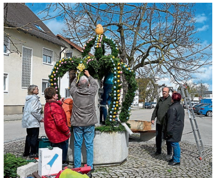
Mit rund 400 Ostereiern wurde die Osterkrone am Keltenbrunnen in der Schulstraße von einigen Mitgliedern des Obst- und Gartenbauvereins nach Corona wieder geschmückt.