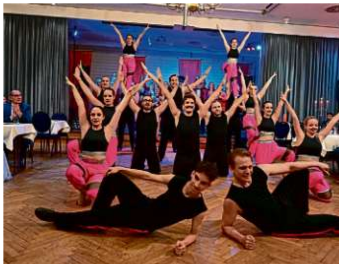
Ob Prinzenwalzer Gardetanz oder Showteil das Publikum war begeistert.