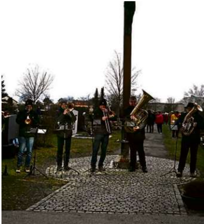
Die Manchinger Muiggassler spielten nach Einbruch der Dunkelheit am Heiligen Abend auf dem Manchinger Friedhof bekannte weihnachtliche Musikstücke.