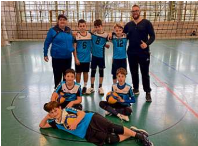
Manchings männliche U14-Jugend beim Querqualifikationsturnier in Hallbergmoos