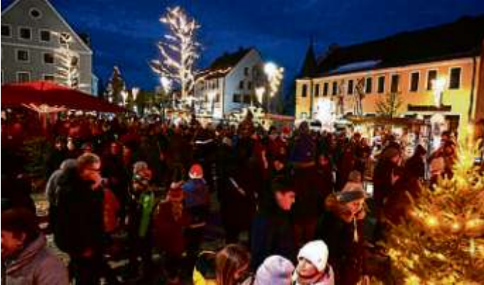
Eine unübersehbare Menschenmasse kam am Wochenende zum Adventsmarkt nach Manching.