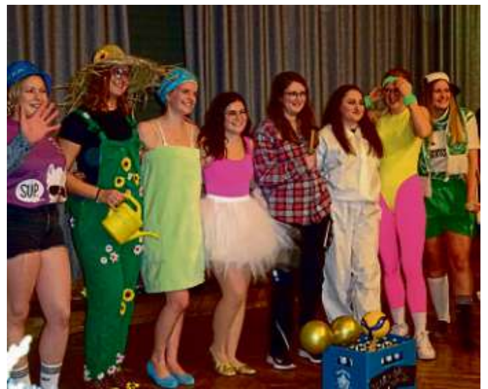
Aufführung der MBB-Volleyballdamen bei der Volleyball-Jahresabschlussfeier 2023