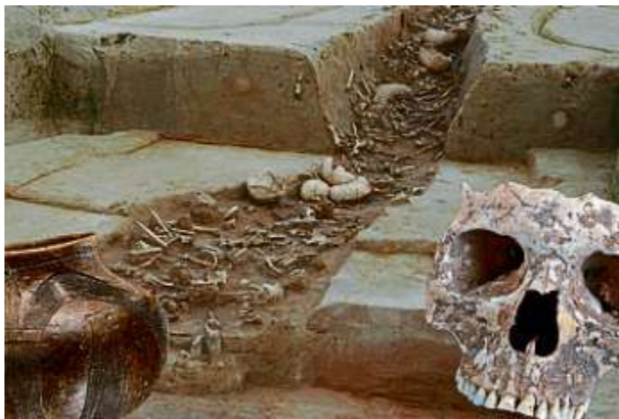
Funde aus der frühneolithischen Grabenanlage von Herxheim.