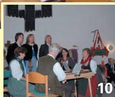
Besinnliche Stunden in der Friedenskirche