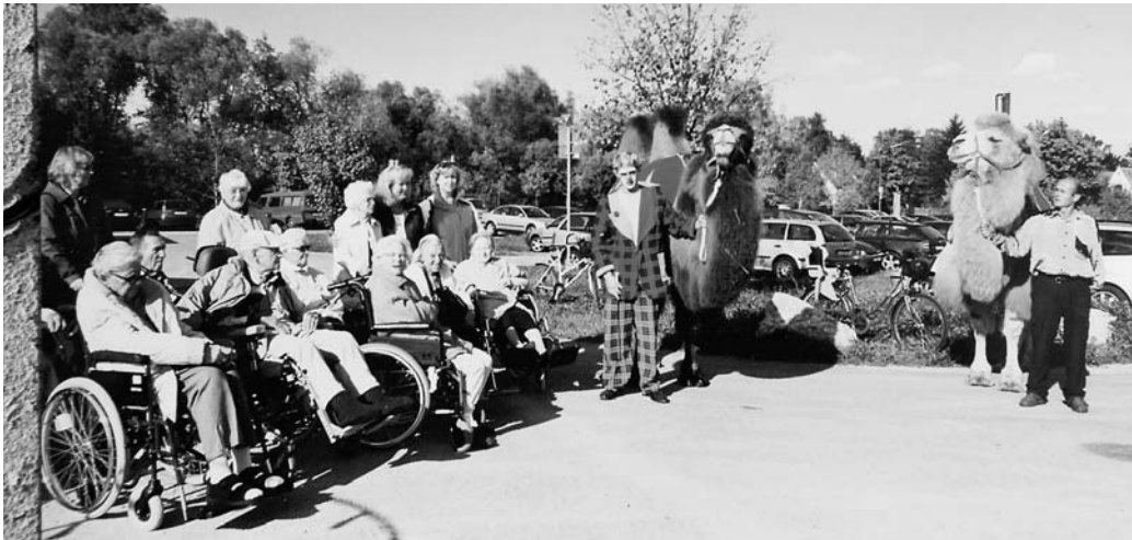
Einen kostenlosen vergnügten Nachmittag verbrachten die Bewohner des Manchinger Seniorenheims im Zirkus, der in Manching gastierte.