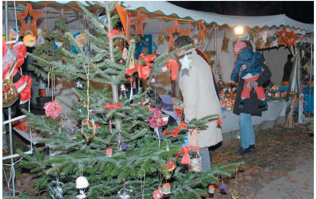
Weihnachtliche Ausstrahlung herrschte auf dem Oberstimmer Christkindlmarkt.

Zur ersten Einstimmung bei dem etwas kalten, aber trockenen Wetter sorgte der Männergesangsverein „Vallatum“