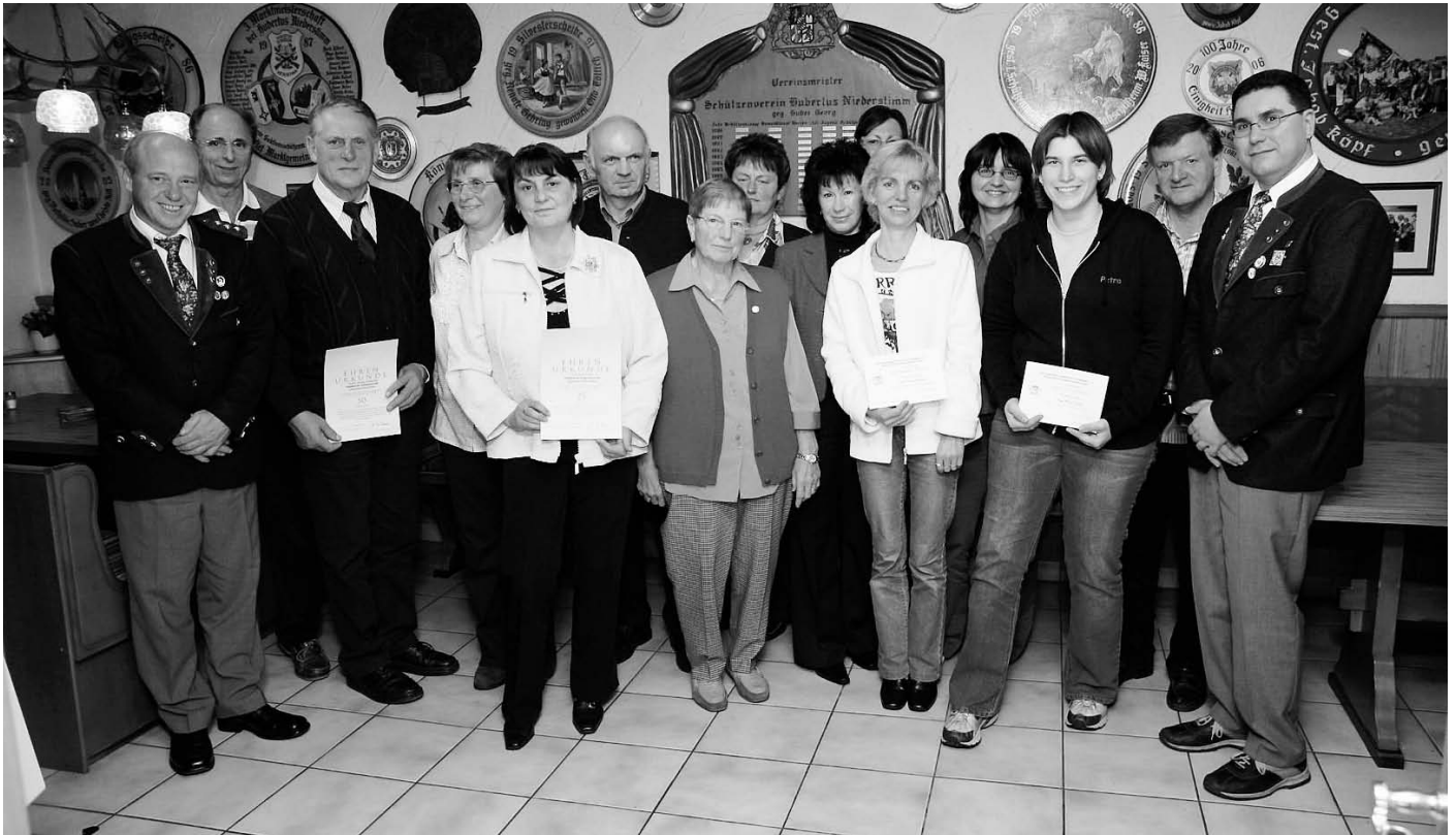
Zahlreich Ehrungen standen bei den Hubertusschützen Niederstimm auf der Tagessordnung.