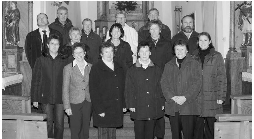
Seit 20 Jahren gestaltet der gemischte Chor aus Westenhausen und Ernsgraden gesanglich die Gottesdienste in beiden Kirchen. Schmidtner

Doch dies alles konnte den engagierten Chorleiter mit seiner Stammmannschaft nicht entmutigen und er baute mit Elan eine Chorgemeinschaft