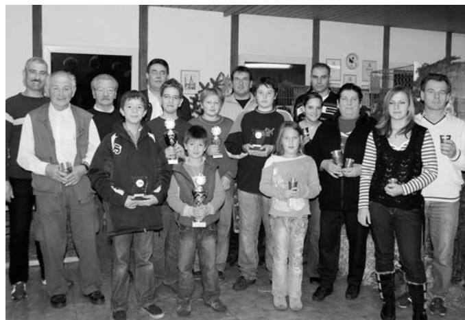
Stark war die Jugend unter den Preisträgern bei der Kaninchenausstellung in Manching vertreten. Schmidtner

Eine gewisse Faszination muss der Umgang und das Züchten von Tieren schon auf die Jugend ausüben, sonst würden nicht so viele Nachwuchsmitglieder bei der gemeinsamen Kaninchen-schau in Manching Preise abräumen. Zum sechsten Mal veranstalteten die Ingolstädter und Manchinger Kaninchenzüchter im Vereinsheim in Manching eine Rassekaninchen-Ausstellung.