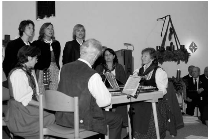
Im Lichterschein der Kerzen fand in der Friedenskirche in Manching das alljährliche Adventsingen statt.