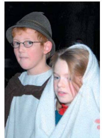
In die Rolle von Maria und Josef schlüpfen Schüler aus der Grundschule Oberstimm.