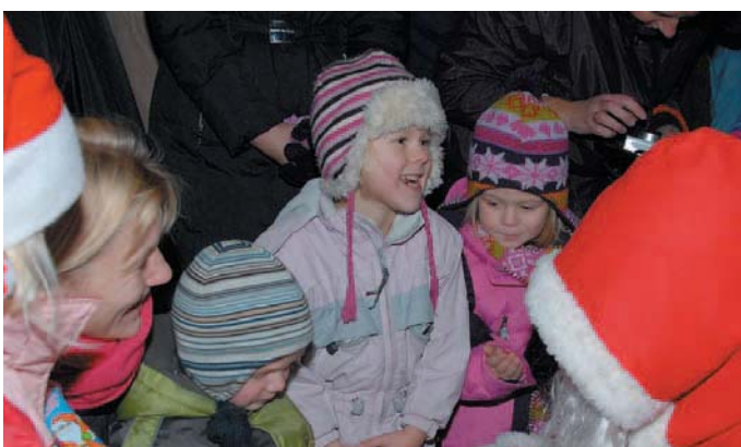
Erleichtert waren die kleinen Besucher, dass der Nikolaus sie nicht in den Sack steckte, sondern Süßigkeiten anbot.