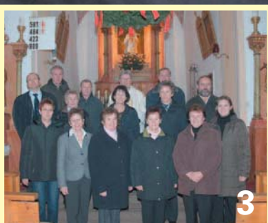
Seit 20 Jahren besteht der Kirchenchor in Westenhausen