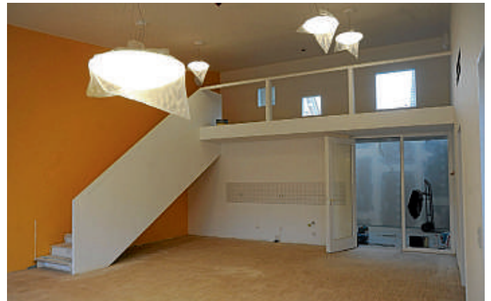
Ein Gruppenraum der Kita noch in der Bauphase