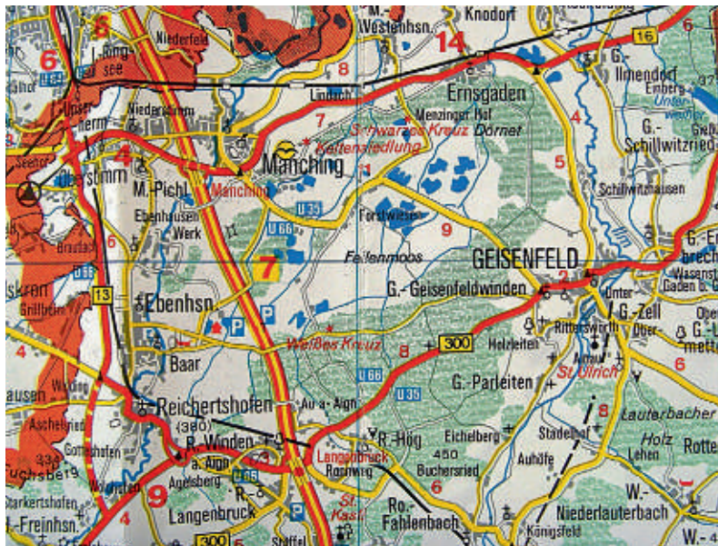
Schwarzes Kreuz und Weißes Kreuz im Ausschnitt der Landkarte vom Landkreis Pfaffenhofen

Beim Bombardieren und der Umgestaltung des Flugplatzes war dann das Schwarze Kreuz ver-