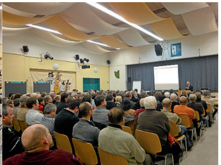
Die Aula der Hauptschule im Lindenkreuz war mit ca. 270 Gästen bei der Auftaktveranstaltung zur Gemeindeentwicklung sehr gut besucht.