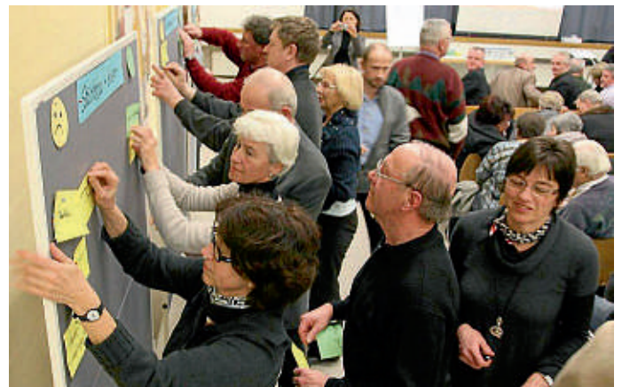
Der Andrang an den Thementafeln war groß.

zum generellen Ablauf durch Moderator Wolfgang Grubwinkler, Inhaber des Planungsbüros Identität & Image, war die Mitarbeit der Manchinger Bürgerinnen und Bürger angesagt. Auf grünen und gelben Zetteln hatten sie die Möglichkeit stichpunktartig anzugeben, was ihnen an Manching gefällt und was nicht. Sieben Themenfelder standen hierzu zur Verfügung: