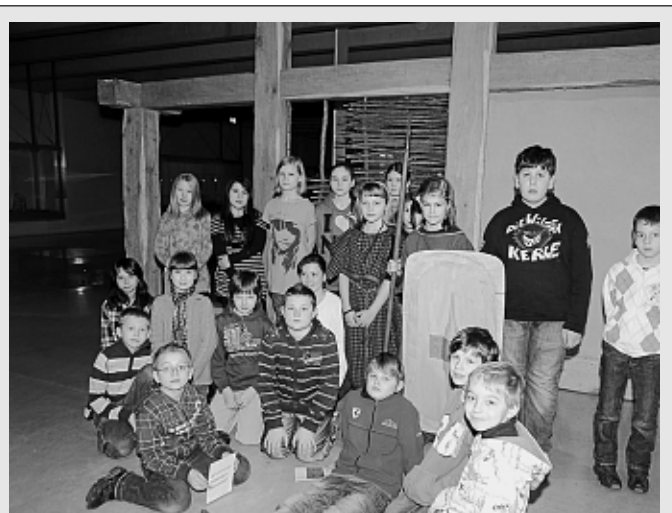
Einen Ausflug in das Manchinger Kelten-Römer-Museum machten die Grundschüler der Klasse 4b aus Oberstimm. Dabei erfuhren die Schüler nicht nur etwas über das Leben der Kelten, sondern sie durften auch die Kleidung jener Zeit tragen.