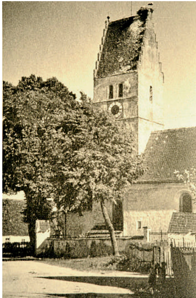
Die Niederstimmer Kirche blickt auf eine 700-jährige Geschichte zurück.

Gezwungenermaßen mussten alle Untertanen diesem Glaubensslalom folgen und so verwundert es nicht, dass 1619 erneut alle Einwohner zu Niederstimm vorgeladen wurden, um eine Erklärung