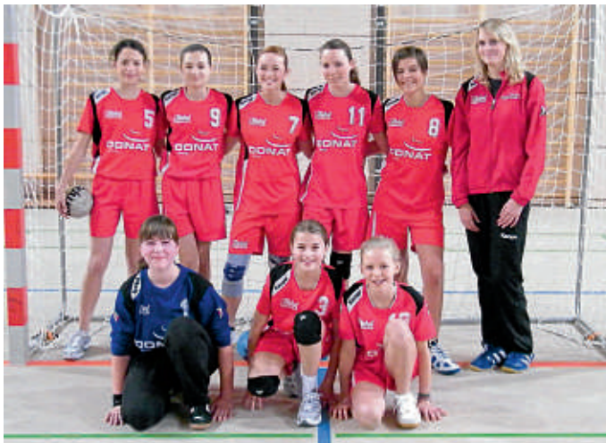
Die weibliche C-Jugend der MBB SG Manching

Nicht minder erfolgreich sind die weiteren Handball-Jugendmannschaften der MBB SG Manching. Mit 2 Siegen hintereinander zeigte die weibliche D-Jugend endlich,