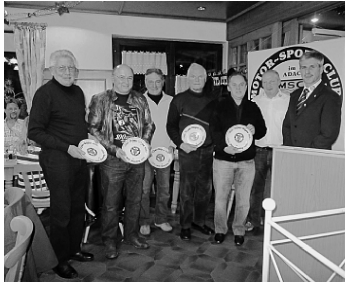
Ehrungen langjähriger Mitglieder im Rahmen der Jahreshauptversammlung

Mittlerweile ist die Jugendgruppe des MSC auf 90 Mitglieder angewachsen. Auch im Hinblick auf die erfolgreiche Jugendarbeit appellierte Dangers an das Verständnis der Manchinger Bevölkerung bzgl.