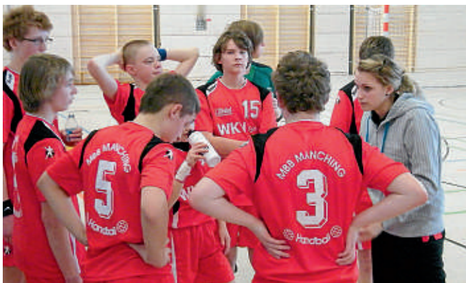
Team „Time-Out“ der männlichen C-Jugend

was in ihr steckt und sich die Trainingsmühen gelohnt haben.