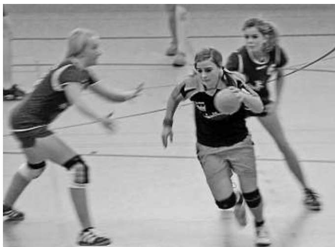
Die weibliche C-Jugend auf dem Weg zur Meisterschaft?

Zum Topspiel gegen den Tabellenzweiten, die DJK Eichstätt, kommt es am 6. Februar in der Lindenkreuzhalle für die bis dato ungeschlagene weibliche A-Ju-