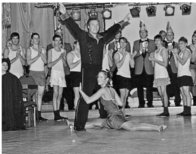
Prinzenpaar Roman II. und Juli I. mit Ihrer oskarreifen Show und im Hintergrund ganz sexy die MANSCHUKO-Dream-Boys

Nachdem ein jeder Partylöwe auch mal Zeit zum Ausruhen braucht, waren die weiteren Show-Acts eine willkommene und stimmungsgeladene Abwechslung. Zunächst kam die Gaudi-Truppe des SV Manching „Manschlucktso“ zum Einsatz. Sie hatten sich mit ihren Kostümen ganz dem Publikum angepasst. Als Biene Maja, Pippi Langstrumpf und Schlümpfe legten Sie zu Filmchoreographien eine flotte Sohle aufs Parkett. Die „Discohatscher“ in fescher Lederhose und Trachtenhemd hatten wieder bayerische Schuhplattlkunst zu modernen Diskorhythmen zu bieten. Zu „Infinity“, „Sing Halleluja“