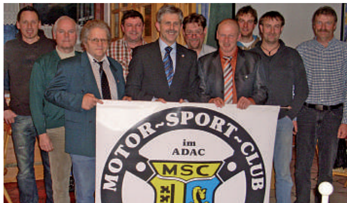
Die neu gewählte Vorstandschaft des Motor-Sport-Club Manching

Nach drei dritten Plätzen hat der Club es geschafft, die Wertung „Ortsclub des Jahres“ des ADAC Südbayern nach Manching zu holen. Im Rahmen der Delegierten- und Jahreshauptversammlung des