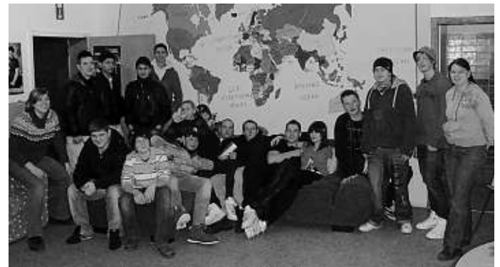
Großen Zuspruch fand das in den Faschingsferien veranstaltete Dartturnier in den Jugendräumen des Bürgerhauses „Miteinander“.

Die Mobile Jugendarbeit Manching des Diakonischen Werks Ingolstadt wird vom Markt Manching, dem Landkreis Pfaffenhofen und dem Bund-Länder-Programm „Soziale Stadt“ gefördert.