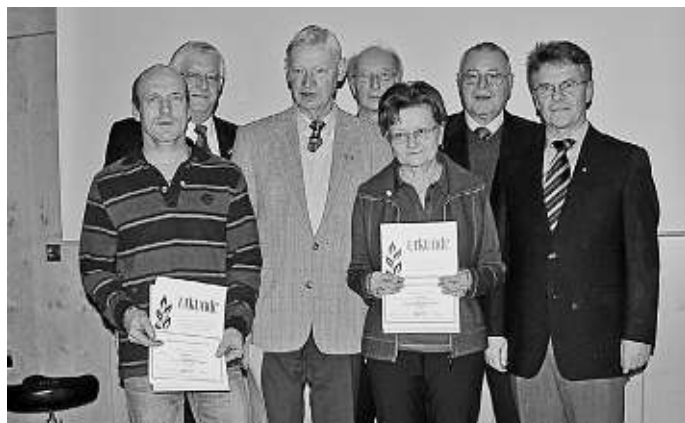
Ehrung der langjährigen Vereinsmitglieder (40 und 45 Jahre)