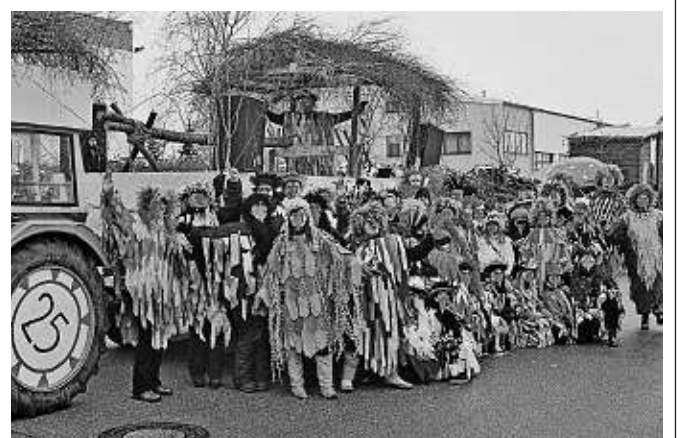
Die MBB-Volleyballer als „Voglwuide Wolliballa“ beim Manchinger Faschingsumzug