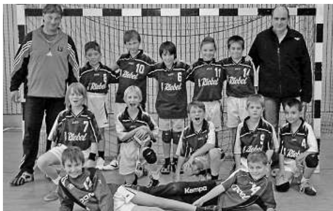
Die E1-Jugend der MBB SG Manching.

gend. Wenn alles gut geht, kann am 14. März in der Realschulhalle eine Doppelmeisterschaft gefeiert werden.