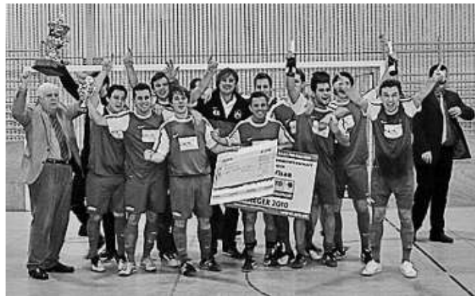
So sehen Sieger aus: die Fussballer des SV freuen sich über den Gewinn der Hallenkreismeisterschaft

In der Endrunde, die am Dreikönigstag in der Manchinger Lindenkreuzhalle ausgetragen wurde, trafen die Grün-Weißen in ihrer Gruppe auf RW Klettham, ST Kraiberg und TSV Mailing. Im ersten Spiel gegen den A-Klassisten RW Klettham hatten die SVler keine Probleme und siegten locker mit 5:1-Toren. Dann ging es gegen den ST Kraiberg. In einer spannenden Begegnung behielt