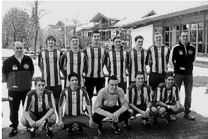
Wurden erstmals Kreismeister im Hallenfußball: die A- Junioren des SV Manching

Im ersten Spiel gegen den Liga-Konkurrenten FC Moosinning reichte es nur zu einem 2:2 Unentschieden. Gegen den Landesligisten SE Freising hatten die jungen SVler keine Chance und verloren mit 1:3. Im letzten Vorrundenspiel gegen die JFG Eichstätt gab es erneut ein 2:2-Unentschieden. Nachdem Moosinning und Eichstätt gegen Freising verloren und im direkten Duell 1:1-Unentschieden spielten, waren drei Mannschaften jeweils punktgleich und der SV Manching zog aufgrund der mehr geschossenen Tore ins