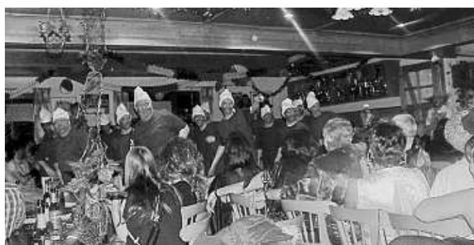
Die „Kleinen Schlümpfe“ der Faschingsgesellschaft „Manschluktsko“ begeisterten im ausverkauften Sportheim das Publikum

In der Bar herrschte Hochbetrieb dank Disco mit DJ Andi, der „heiße Scheiben“ auflegte, die besonders die jüngeren Faschingsgäste begeisterten. Erfreulich auch, dass fast alle Ballbesucher sich phantasievoll maskiert hatten und so von Anfang an eine super Stimmung herrschte.