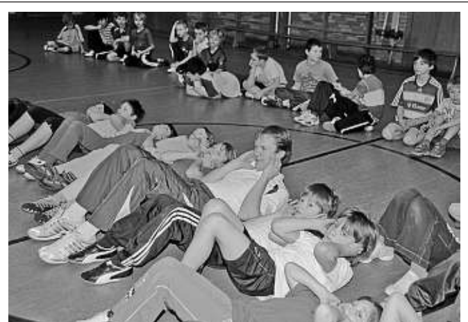
Im Jahr des Sports durften die Grundschüler aller dritten und vierten Klassen in Oberstimm mit dem schwedischen Rennfahrer Mattias Ekström, der viele Tourenrennwagen-Meisterschaften gewonnen hat, in der Turnhalle sein tägliches Fitnessprogramm zur Freude der Kinder mitüben.