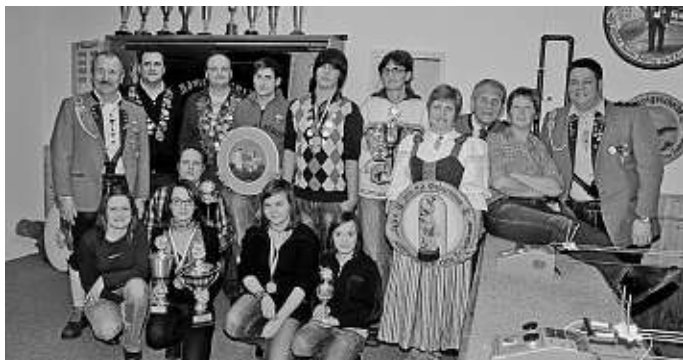
Zum Gruppenbild stellten sich die Könige und Sieger der Römerschanzschützen auf.