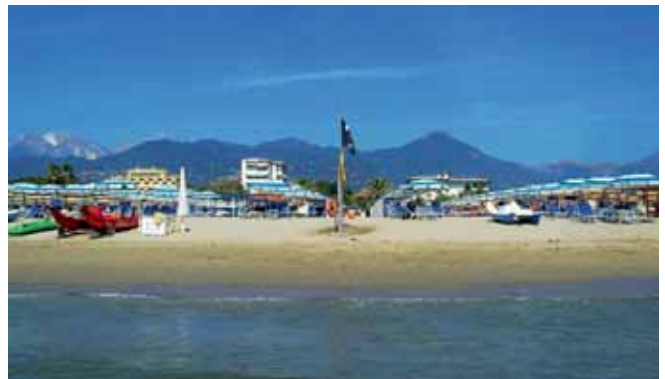
Ein Badeausflug der Manchinger führte ans 45 km entfernte gelegene Mittelmeer (Riviera).