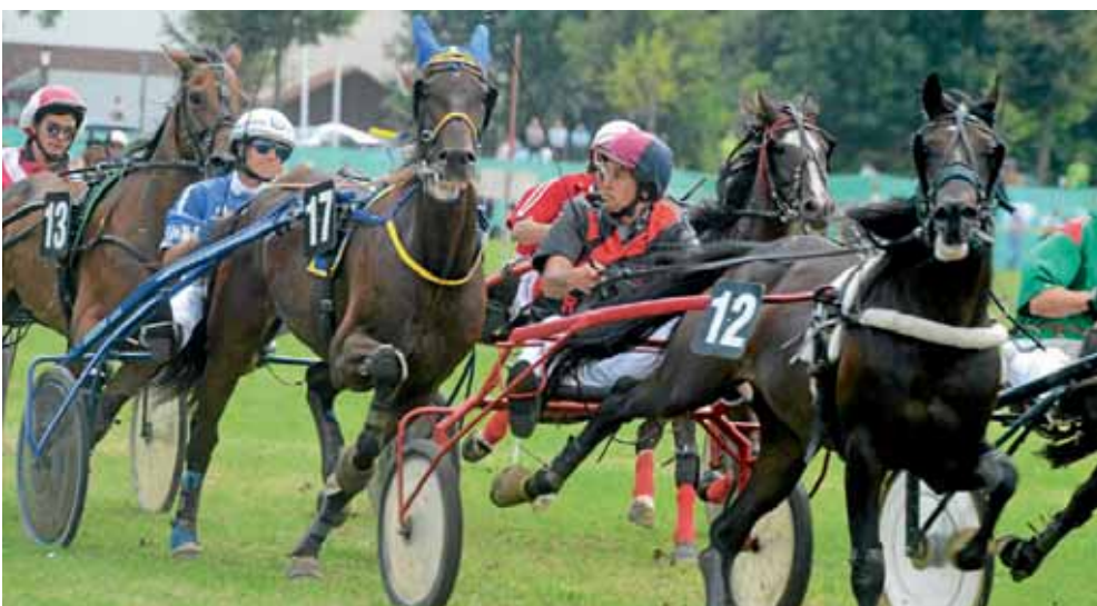
Traditionelles Pferderennen am Barthelmarkt-Samstag