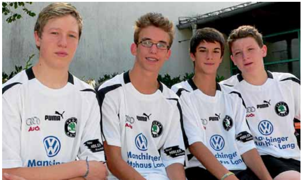
Ein Teil der U16-Tainingsgruppe bei der Manchinger Volleyballmarktmeisterschaft 2012.