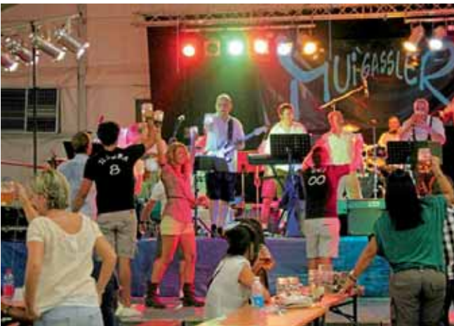
Die Muigassler Musikanten aus Manching heizten den Italienern an fünf Bierfestabenden ein.