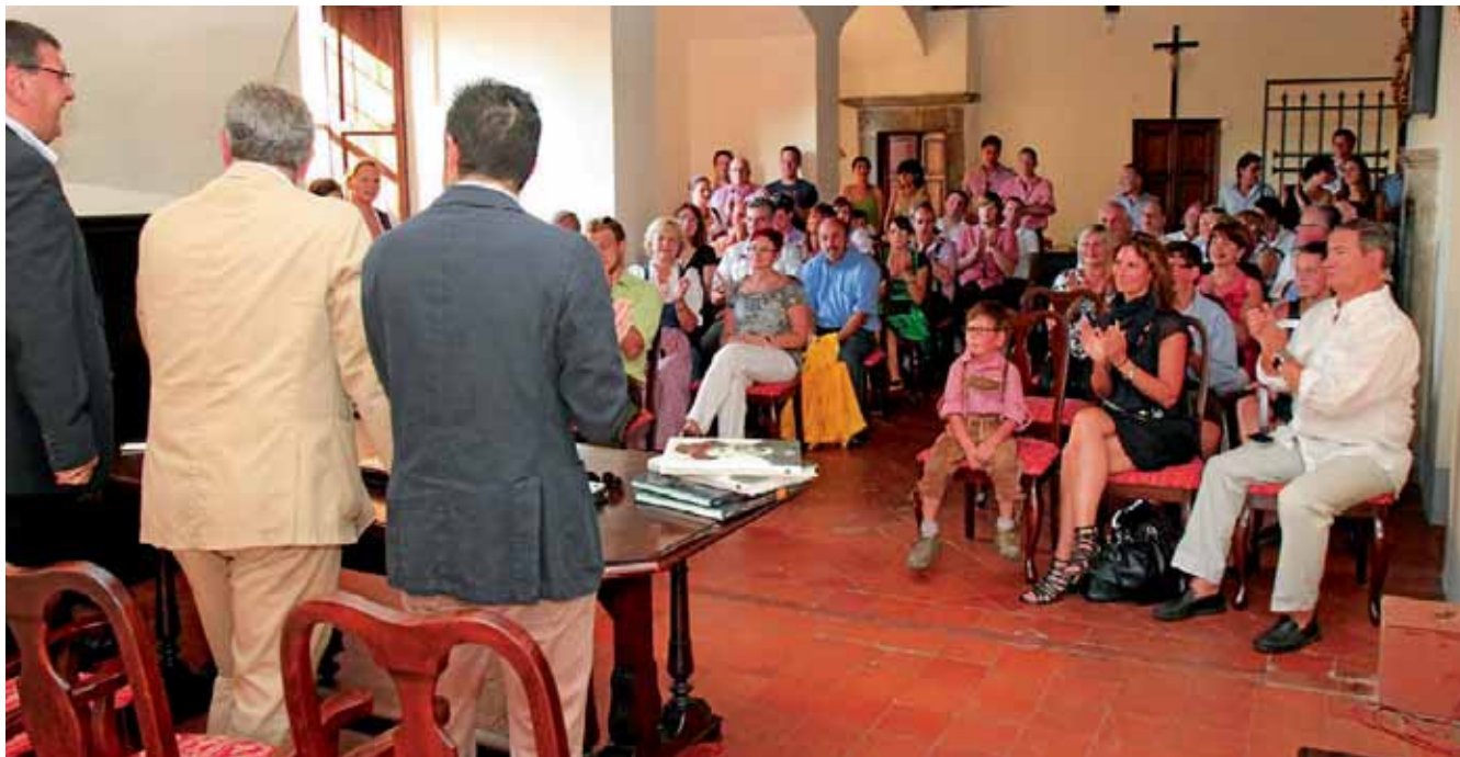
Offizielle Begrüßung im kleinen Sitzungssaal des Stadtrates.