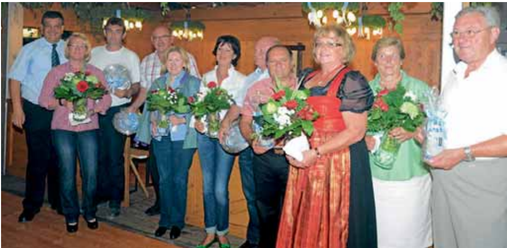
Manchings Bürgermeister Herbert Nerb ehrt am Vorabend des Barthelmarktes langjährige Marktkaufleute.