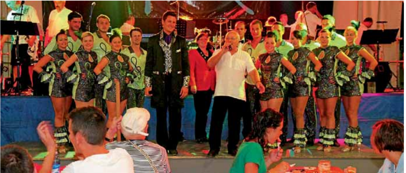
Großer Auftritt der Faschingsgesellschaft Manschuko beim Bierfest 2012. Im Bildhintergrund die Muigassler Musikanten aus Manching.