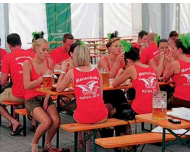
Die Manschukogarde bei der Stärkung vor einem der drei abendlichen Auftritte beim Bierfest.