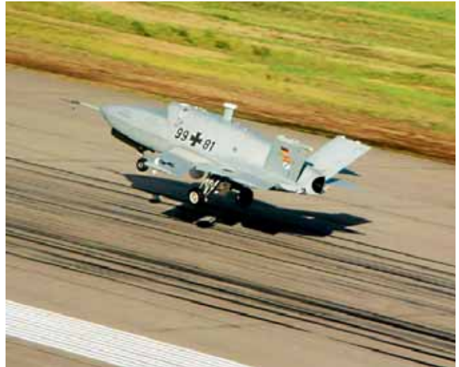
Barracuda bei der Landung.