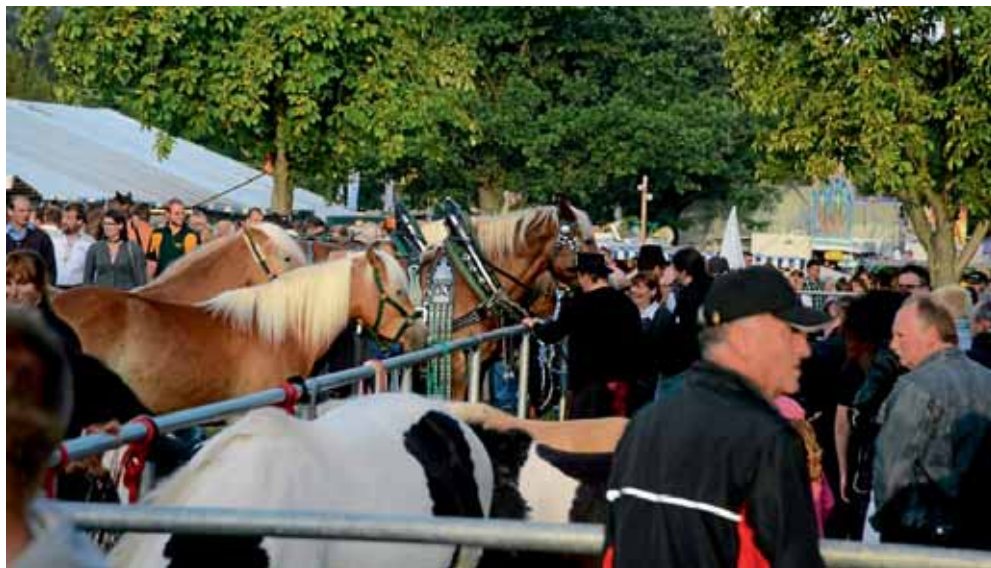
Rossmarkt am Barthelmarkt-Montag (ab 6.00 Uhr)