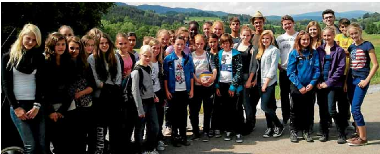
Die MBB-Volleyballjugend beim Jugendcamp in Viechtach.