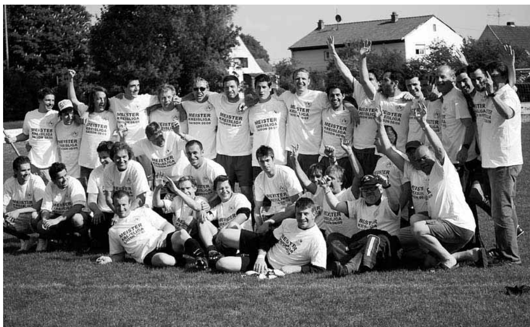
Meister in der Kreisliga und Aufsteiger in die Bezirksliga: die erste Mannschaft des SV Manching!