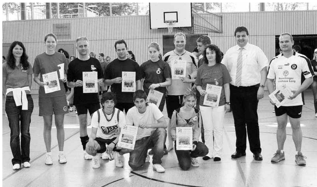
Die Kapitäne aller Mannschaften nach der Siegerehrung mit Bürgermeister Herbert Nerb (2. v. rechts).