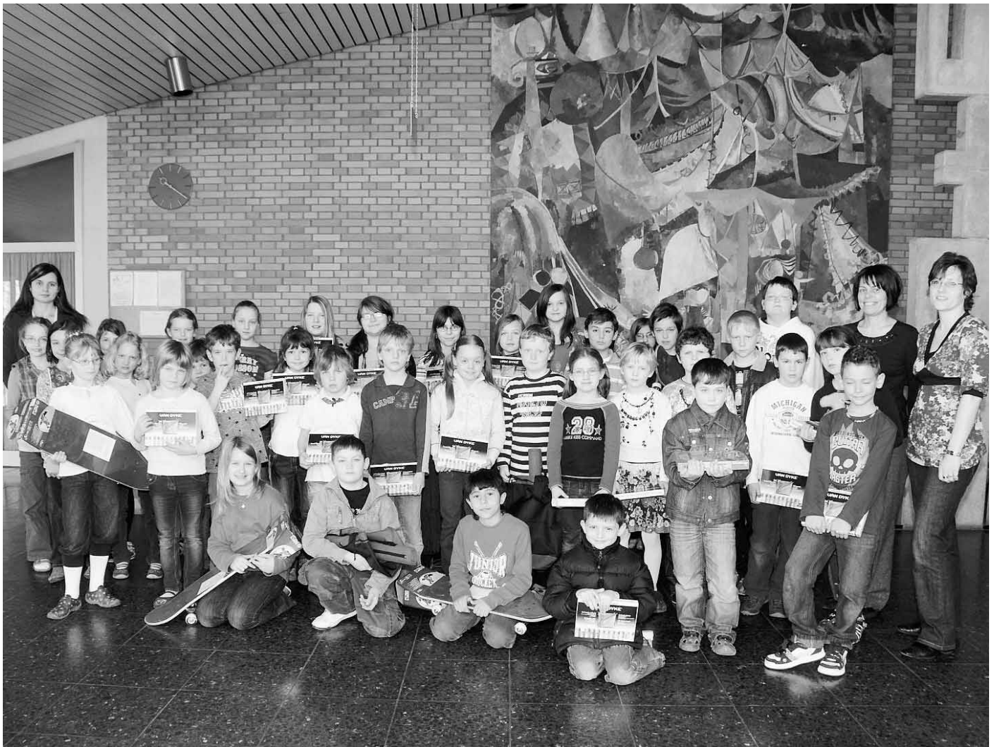
Die Spannung war den Schülern aus der Grundschule Oberstimm/ Donaufeld anzumerken, als die Hallertauer Volksbank die Preise für den ausgeschriebenen Malwettbewerb, der unter dem Motto stand „Mehr Menschlichkeit, auf dich kommt's an“, überreichten.