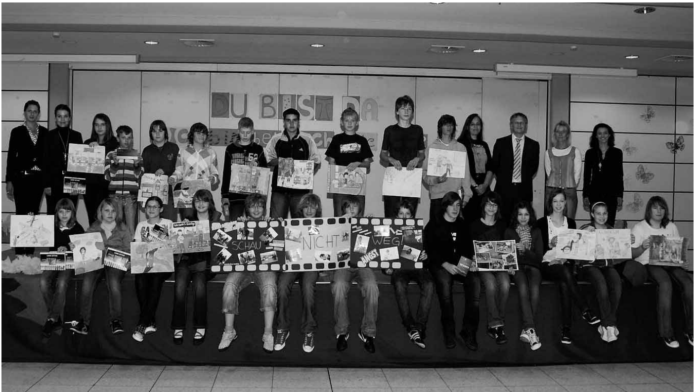
Mit Sachpreisen wurden die besten Arbeiten der Realschüler am Keltenwall in Manching für die Teilnahme am 39. Internationalen Mal- und Zeichen-Jugendwettbewerb, der unter dem Motto stand „Mehr Menschlichkeit, auf dich kommt's an“, von der Hallertauer Volksbank prämiert.