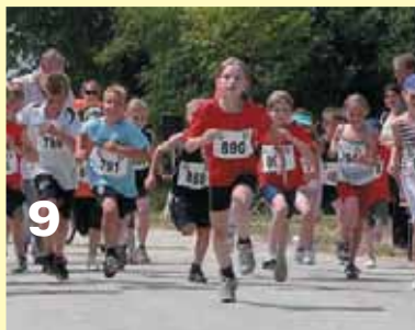
Vierter Manchinger Museumslauf