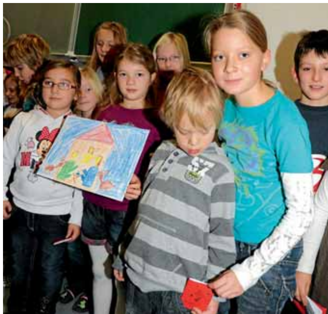
An der Grundschule in Oberstimm wird seit fünf Jahren das Patenprojekt „Klein und Groß gehen den Weg miteinander“ durchgeführt. Die Kinder der 4. Klassen bastelten für ihre Patenkinder einen Hosentaschenkalender mit 24 Seiten. Die Erstklässler gestalteten für ihre Paten einen künstlerischen Kalender. Der Hintergrund für dieses Patenprojekt ist laut Rektorin Gudrun Füßl, dass die Kinder Verantwortungsbewusstsein entwickeln und soziales Handeln lernen.