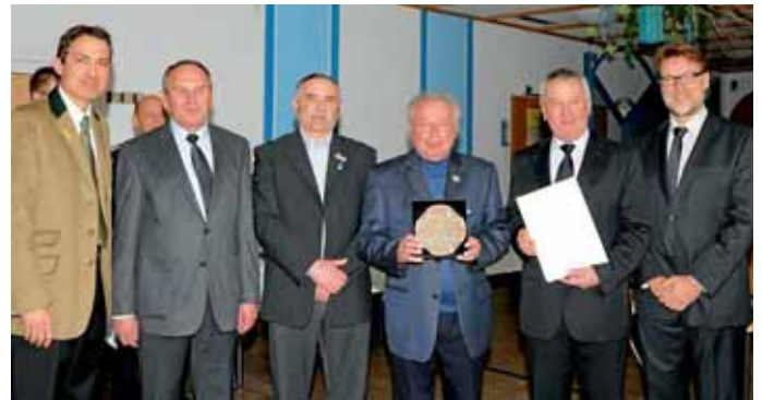
Der Manchinger Krieger- und Veteranenverein konnte die stolze Summe von 1613 Euro an die Kriegsgräberfürsorge übergeben.