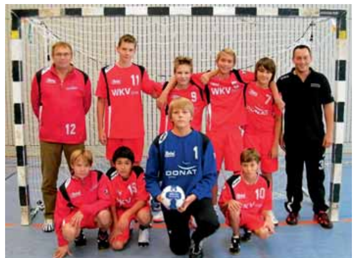
Männliche C-Jugend der MBB SG Manching.