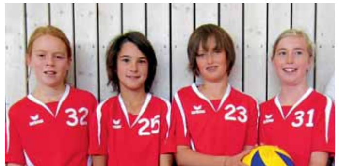
Die MBB-Volleyballmädchen der U13 qualifizierten sich als Vize-Kreismeister für die Oberbayerische Meisterschaft.