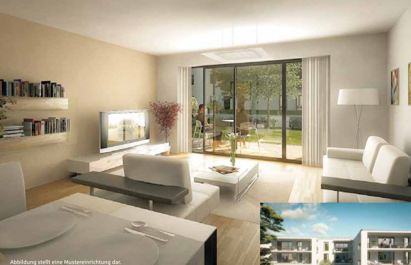
Abbildung stellt eine Mustereinrichtung dar.