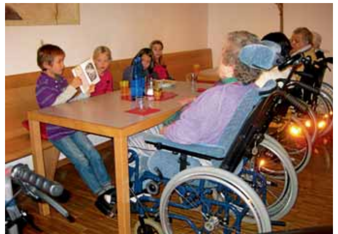
„Wir lesen vor – überall und jederzeit“ hieß das Motto im November an der Grundschule in Oberstimm. Neben dem Kindergarten Donauefeld besuchten die Schülerinnen und Schüler auch die Bewohner des Manchinger Seniorenheims. Dort lasen die kleinen Leseratten sehr zur Freude der älteren Generation einige Geschichten vor und bekamen dafür viel Beifall.