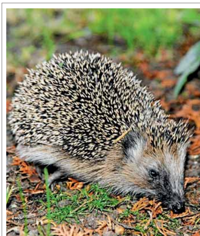
Bei der warmen herbstlichen Witterung sind die Igel noch auf Futtersuche. Doch bald werden sie sich unter Laub für den Winterschlaf vergraben.

Cassidian, eine Division des EADS-Konzerns, ist einer der weltweit größten Anbieter globaler Sicherheitslösungen und