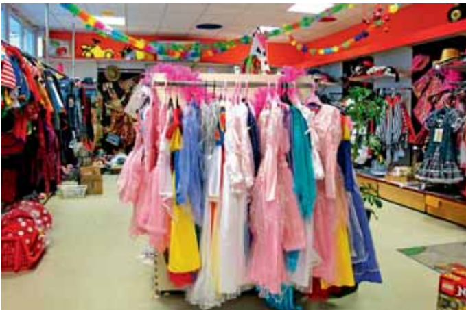
Große Auswahl an Faschingsachen bei Spielwaren Köpf.

Spielwaren Köpf hält auch in diesem Jahr wieder ein großes Sortiment an Faschingskostümen, Masken und Utensilien bereit, damit die Kunden für eine