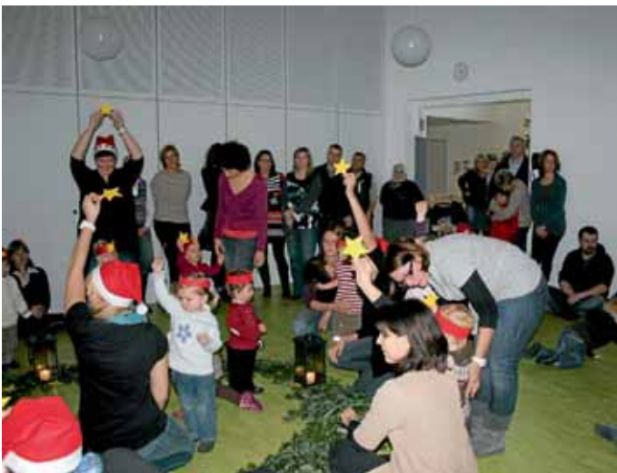
Kinder der „Schatzkiste“ mit Eltern bei der Weihnachtsfeier.