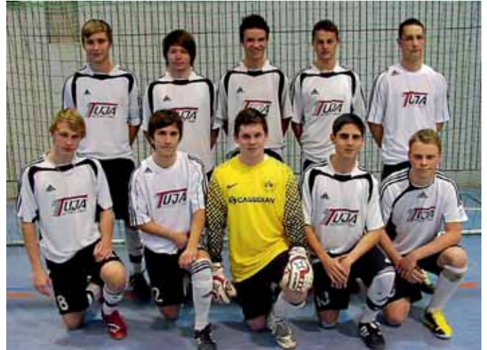
Sieger im Werner-Brehm-Turnier: Die A-Junioren des SV Manching.