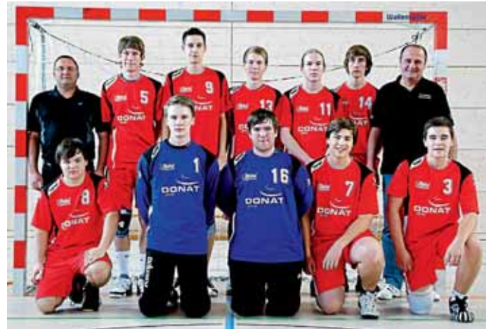
Männliche A-Jugend der MBB SG Manching.