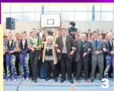
Ein schwungvoller Seniorennachmittag