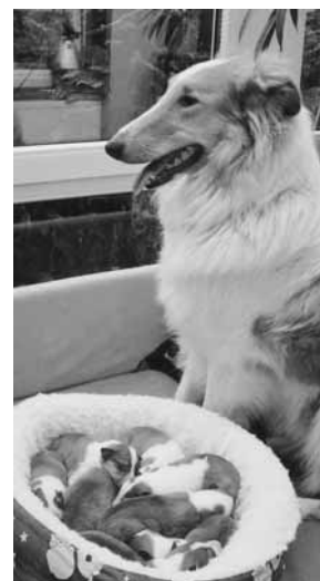
Rund um die Uhr bewacht Lassie, eine Colliehündin, seine acht Welpen, die bei

Donaufeldstraße 22 • 85077 Manching Tel. 0 84 59 • 63 72