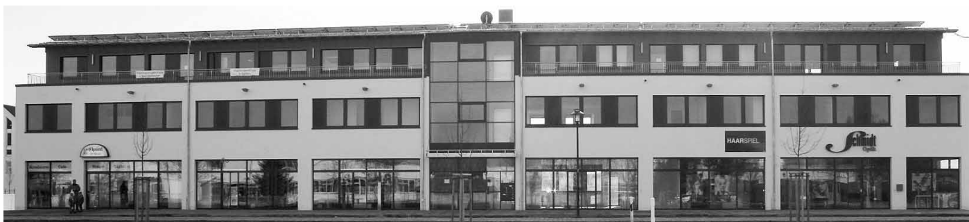
Das neue Gesundheitszentrum gegenüber der Realschule Manching