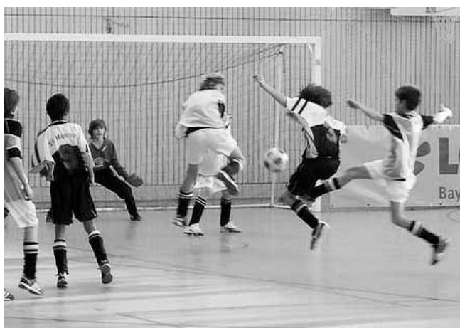
Packende Spielszenen – hier aus einem Spiel der D1-Junioren – erlebten die Zuschauer bei den Fußball-Hallenturnieren des SV Manching.