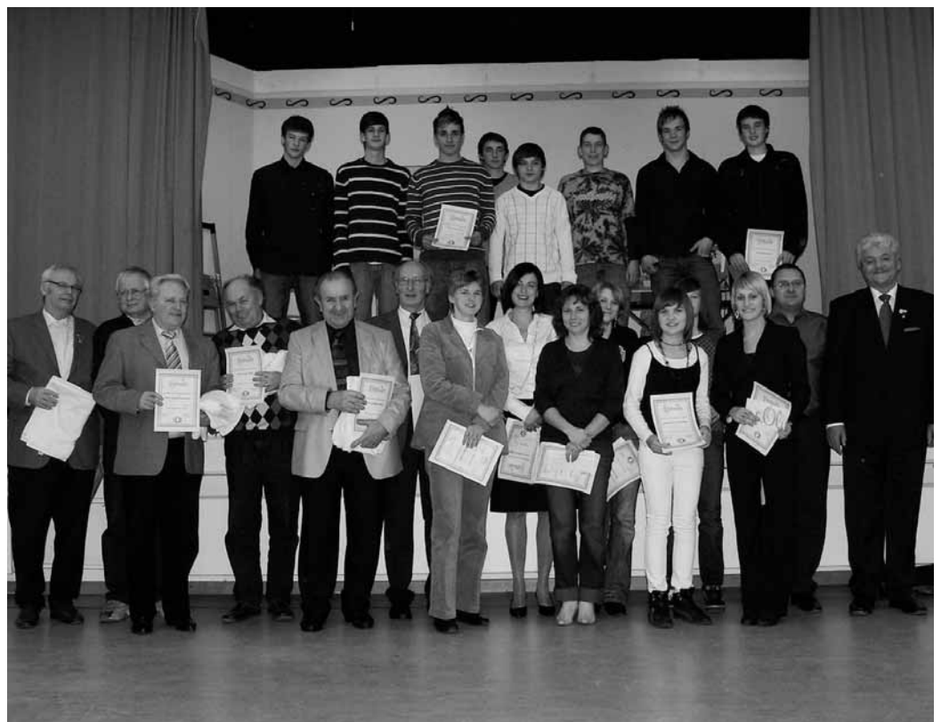
Ehrung der zahlreichen erfolgreichen Sportler der MBB SG Manching