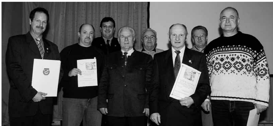
Mit Ehrungen wurden einige Mitglieder für aktiven Einsatz bei den Manchinger Fischern geehrt. Schmidtner

In einer fast dreistündigen Versammlung informierte die Vorstandschaft die 105 anwesenden Mitgliedern nicht nur über die Arbeit an den Gewässern, sondern auch über Ereignisse und Veranstaltungen, an dem die Fischer im Jahresablauf teilnahmen. Besonders hob Loy die kostenlose Nutzung der kleinen Geschäftsstelle hervor, die von den Mitgliedern, die sich dort jeden Freitag treffen wie ein Kleinod behandelt wird. Ein Dank erging auch an die vielen Freiwilligen, wenn es auch nur immer dieselben sind, die sich in den Dienst des Vereins