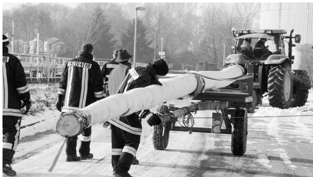
17 Manchinger Feuerwehrleute machten sich auf dem Weg nach Ebrontshausen, um bei klirrender Kälte einen neuen bereits geschälten Maibaum zu holen. Das 29 Meter lange Schmückstück, das alle vier Jahre am Rathausvorplatz erneuert wird, bekommt im Frühjahr seinen weiß-blauen Anstrich.