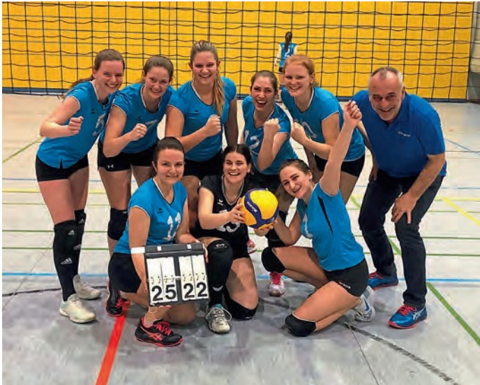
Die erste MBB-Damenmannschaft der abgebrochenen Punktspielrunde 2019/20