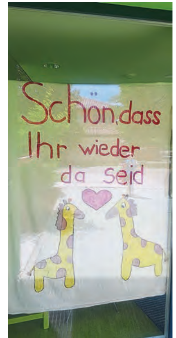
Die Regelungen für den Besuch in der Kita, werden langsam gelockert. Somit können wir mit Zuversicht in die Zukunft blicken. Bis bald, Euer Team, der Kita Schatzkiste im Altenfeld.

Seit dem 25. Mai kam wieder etwas mehr Leben in unsere Schatzkiste. Spätestens um halb 9 konnten wir unser Vorschulkinder wieder alle begrüßen. Nicht nur die Kinder sondern auch wir Erzieher waren sehr gespannt, was der erste Tag mit sich bringt. Wie soll es anders sein? Unsere Vorschulkinder kamen in die Kita, als wären sie nie weg gewesen. Wir haben es so vermisst, durchs Haus zu gehen und von weitem schon das Lachen der Kinder zu hören.