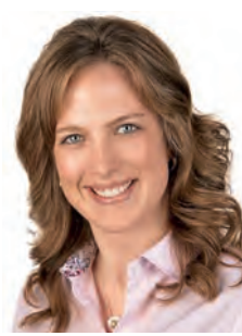
Görlitz Victoria, CSU

Ausschuss für Bauwesen, Umwelt- und Naturschutz, Land- und Forstwirtschaft Kultur-, Sport und Sozialausschuss