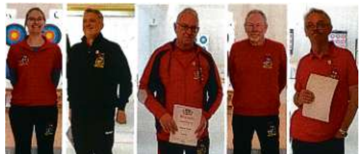
Die erfolgreichen Bogenschützen der MBB-SG Manching