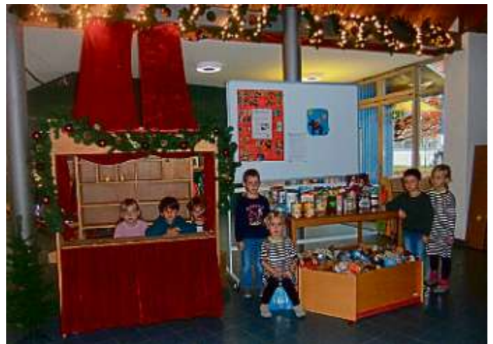
Auf dem Bild: die kleine Losbude und gespendete Lebensmittel