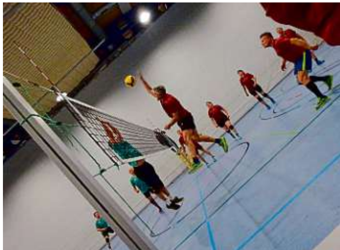
MBB-Mittelblocker Gerald Prawda im Angriff gegen Wolnzach