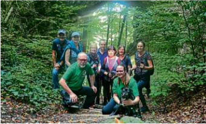
Gruppenbild der MBB-Wanderer am „Torfelsen“ Winfried Lüdtk

Am 03. Oktober trafen sich die Wanderer der Abteilungen Gymnastik/Turnen und Skilauf, Wandern & Nordic Walking zu ihrer diesjährigen Herbstwanderung „Burgenweg Kinding“. Ausgangspunkt für die Wanderung war der Parkplatz an der Abzweigung St2230 Richtung Kipfenberg gegenüber der 1784 erbauten „Römerbrücke“.