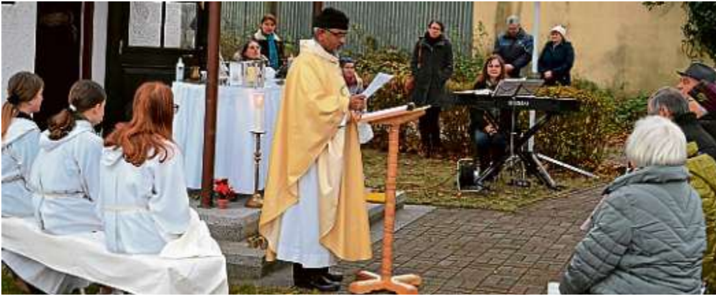
Es ist schon Tradition, dass in Forstwiesen, Ortsteil von Manching vor der Kapelle einmal im Jahr ein Gottesdienst abgehalten wird.