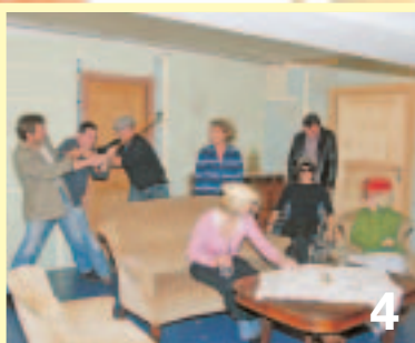
Die Theatergruppe SV Oberstimm spielt das Stück „Nichts gehört – nichts gesehen“