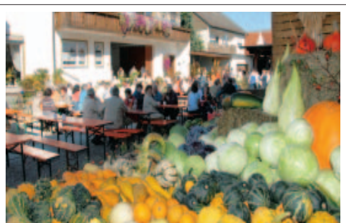
Ein voller Erfolg war das im Oberstimmer Anwesen des Landwirts Xaver Widmann durchgeführte Erntedankfest. Die Besucher konnten sich über die vielfältige Angebotspalette der Landwirte informieren.