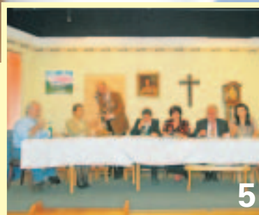
Die Manchinger Theaterbühne führt das Stück „A Rua is' Bua!“ auf.