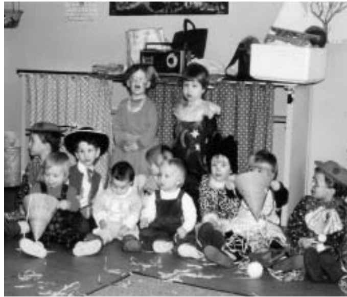
Die erste Faschingsfeier der Mutter-Kind-Gruppe Manching im Gruppenraum des Pfarrsaals an der Pfarrer-Frey-Straße. Auch heute treffen sich die Mütter mit ihren Kindern noch in diesen Räumlichkeiten.

Heute muss ein Beitrag von drei Euro bezahlt werden, aber nur für zehn Monate, da im August und im Dezember keine Treffen stattfinden. Mit dem Geld werden weitere Spielsachen angeschafft, aber auch die zahlreichen Aktionen und Ausflüge finanziert. Aus der anfänglichen Gruppe mit fünf Müttern sind mittlerweile fünf Gruppen mit je sechs bis zehn