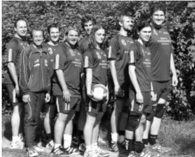
Die erste Herrenmannschaft richtet schon den Blick nach vorn auf die zweite Pokalrunde.

Eine deutliche 0:3-Niederlage gab es für die erste Damenmannschaft gegen den Bezirksklassisten SV Eitensheim. Da den Manchingerinnen überhaupt kein konstruktiver Spielaufbau gelang, siegten die Eitensheimerinnen gegen die völlig konsternierten MBB-Damen klar mit 25:15, 25:12 und 25:17. Auch die zweite Herrenmannschaft kam gegen die jugendlichen Volleyballer des SC Freising III zu keinem Satzgewinn. Dagegen feierte die zweite Damenmannschaft bei der