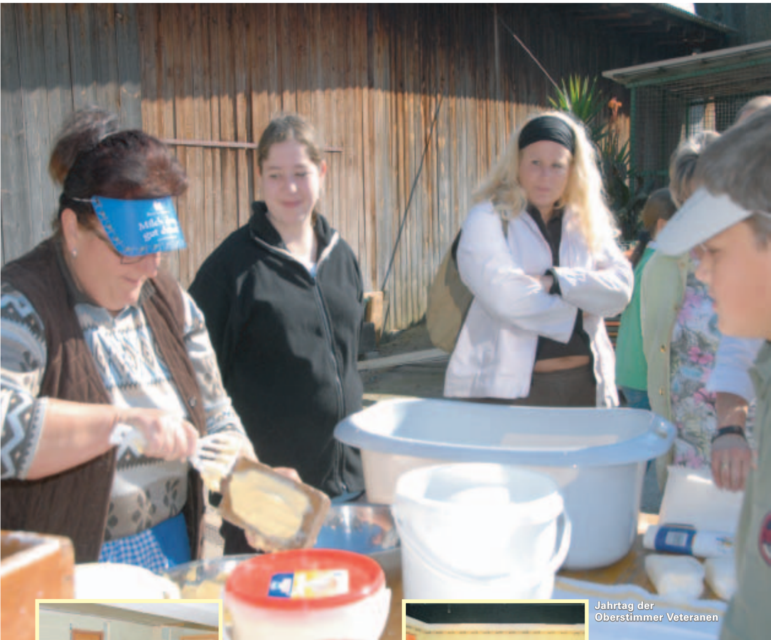
Jahrtag der Oberstimmer Veteranen