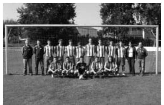
Die A-Jugend mit ihren neuen Fußballtrikots – gespendet vom Manchinger Autohaus Lang.