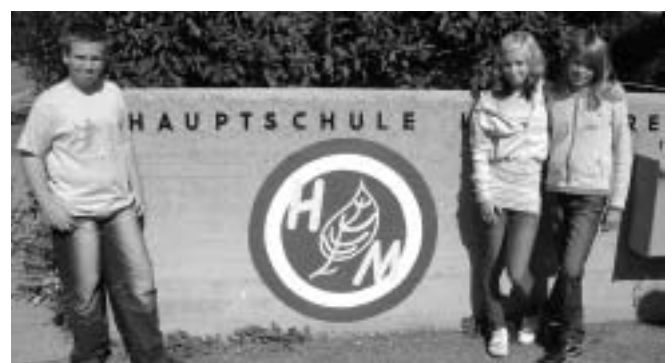
Die Schüler der Hauptschule vor dem neuen Schullogo.