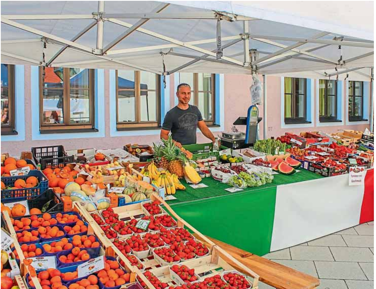
Am Stand von Direktimport Adria werden die Kunden mit feinsten Obst- und Gemüsesorten aus Italien verwöhnt.