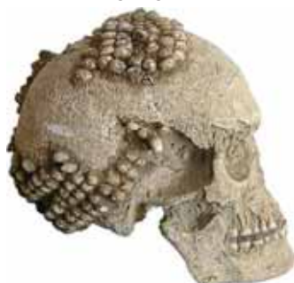
Schädel mit Kopfschmuck aus Donaukahnschnecken aus Niederpörling, Lkr. Deggendorf

Im Erlet 2 85077 Manching 08459/323730 info@museum-manching.de www.museum-manching.de