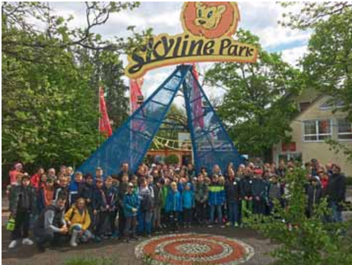
Teilnehmer des Jugendausfluges 2019 der MBB-SG Manching am Skyline Park