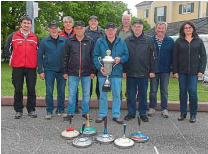
Auf dem Siegerfoto die Gewinner der Stockmeisterschaft die Feuerwehr Manching und die zweitplatzierten der Schützenverein Westenhausen.