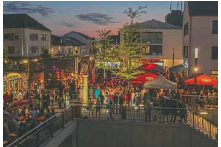
Markt Manching (FoM)

Mittlerweile hat sie sich schon im Veranstaltungskalender etabliert – die Manchinger Sommernacht, die heuer bereits das dritte Jahr in Folge stattfinden wird. Am Samstag, den 6. Juli 2019, laden der Markt Manching und die beteiligten