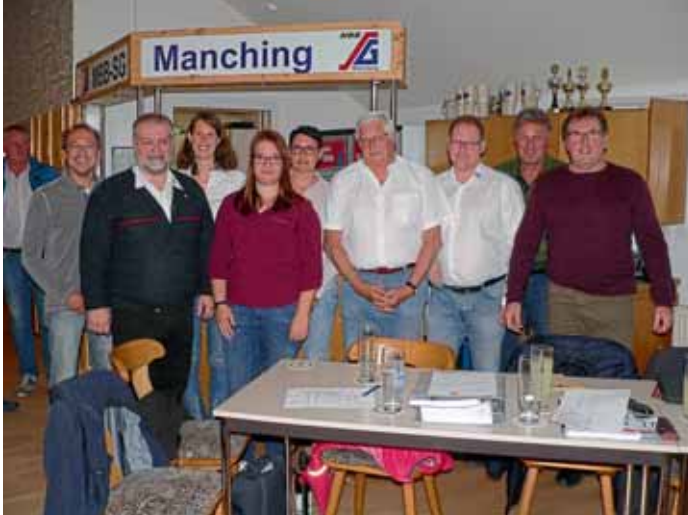
Wieder gewählte Vorstandschaft der MBB-SG Manching