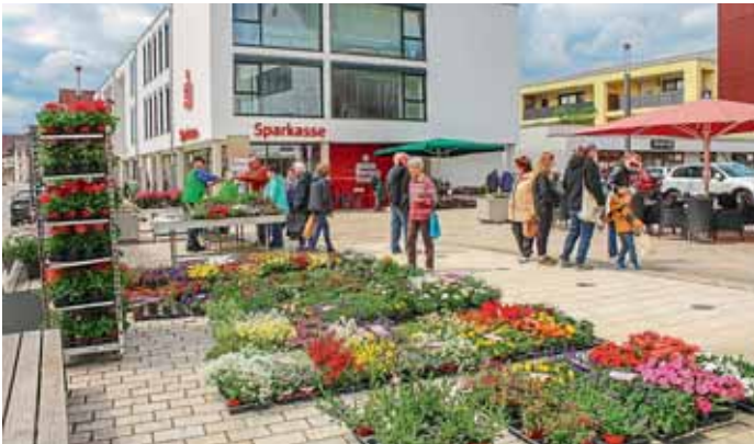
Das Fontänenfeld wird jeden Freitagnachmittag zum Blumenmeer.