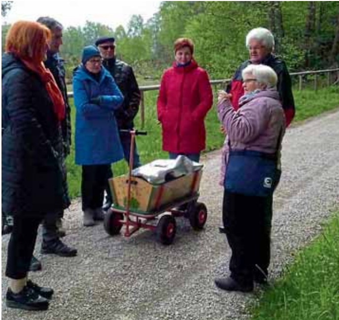
MBB-Tanzsportgruppe bei der Kräuterwanderung durch die Nöttinger Heide