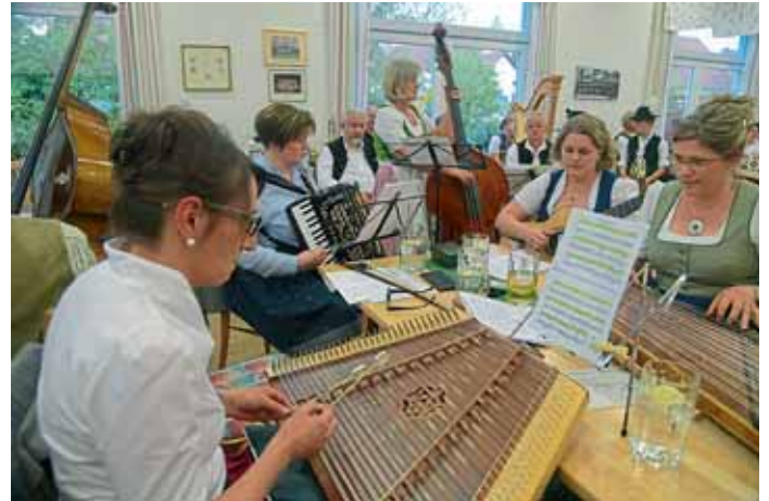
Volksmusik in reinsten Form wurde im Trachtenheim beim musikalischen Hoagarten geboten.