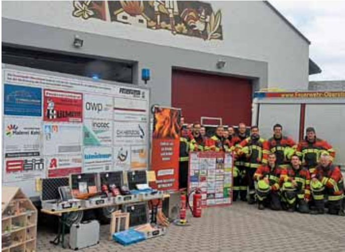
Die ganze Truppe versammelte sich zu einem Gruppenfoto um den neuen Brandschutzerziehungsanhänger in Oberstimm.