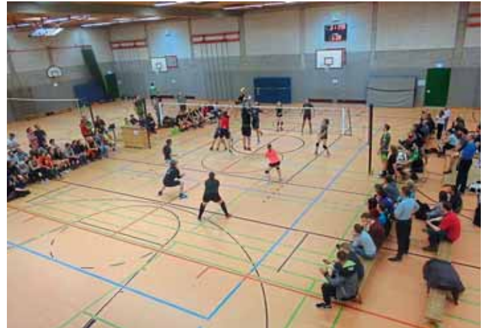
Spielezene aus dem Finale in der DJK-Halle