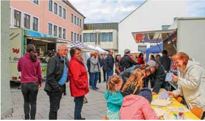
Der Rathausvorplatz ist nun auch ein geselliger Marktplatz.