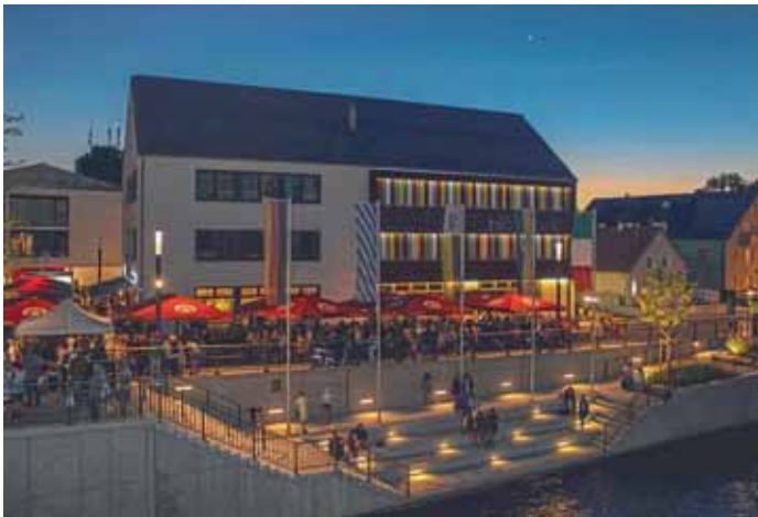
Markt Manching (GrB)