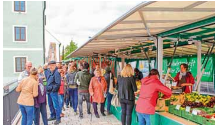
Die Paarbrücke wird zu einer kleinen „Einkaufsstraße“.