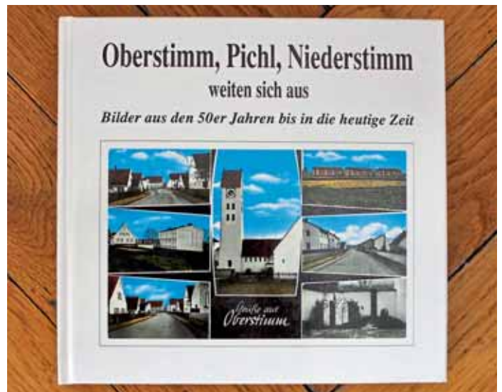
Markt Manching