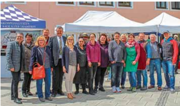
Die Projektgruppe „Manchinger Wochenmarkt“ und ein Teil der Marktbesucher.