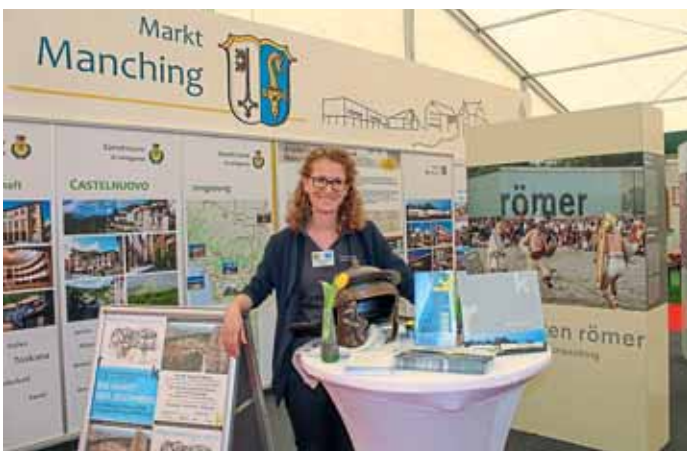
Das kelten römer museum manching präsentierte sich ebenfalls.