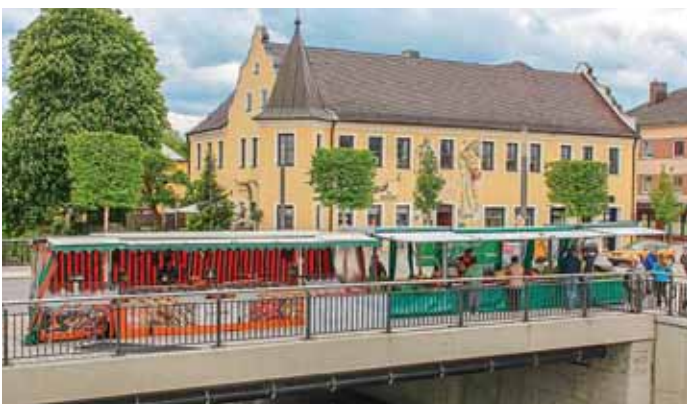
Vom Rathausvorplatz reihen sich die Stände entlang der Paarbrücke bis zum Fontänenfeld.