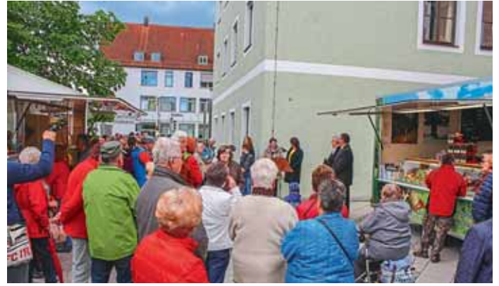
Zahlreiche Anwesende bei der feierlichen Eröffnung.