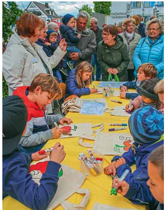
Die Malaktion begeisterte nicht nur die kleinen Künstler.