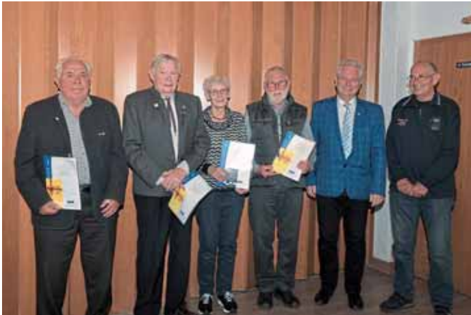
Ehrungen standen beim VdK Ortsverband Manching auf der Tagesordnung.