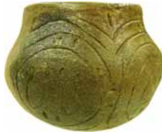
Typisches Gefäß der „Linienbandkeramischen Kultur“ mit der namensgebenden Verzierung aus Niederpörling, Lkr. Deggendorf

Lange galt Bayern als Agrarstaat, und noch heute ist das bäuerliche Element zentraler Bestandteil der kulturellen Identität. Die Anfänge hiesiger Landwirtschaft reichen aber rund 7.500 Jahre bis zum Beginn der Jungsteinzeit zurück. Damals machten Angehörige der sogenannten Linienbandkeramischen Kultur das Land erstmals urbar. Dank der völlig neuen Lebensweise konnten diese Gemeinschaften eine enorme Dynamik entfalten, so dass die bäuerliche Zivilisation geradezu mit einem kulturellen Paukenschlag begann.