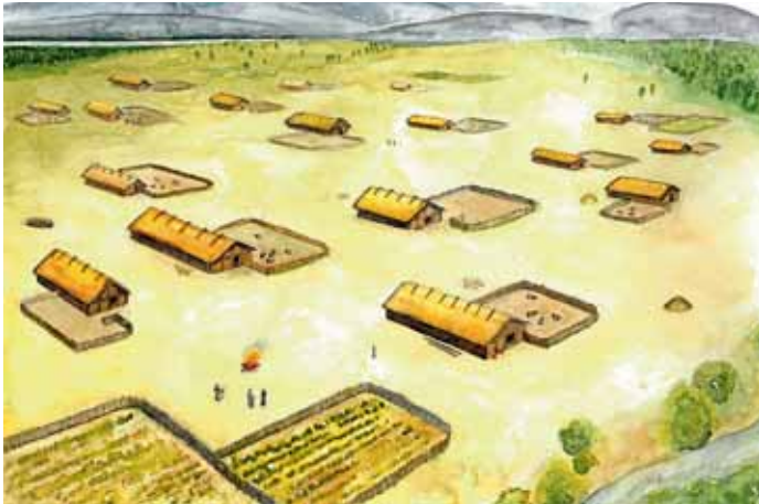
Rekonstruktion der linienbandkeramischen Siedlung von Stephansposching, Lkr. Deggendorf