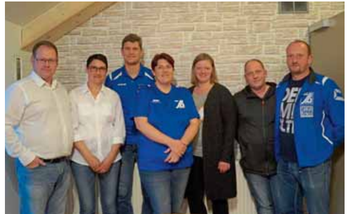
Neu gewählte Abteilungsleitung der Fußballer der MBB-SG Manching