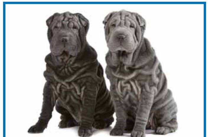
Text: Petra Kufky

In Blech wären die beiden ein Fall für uns!