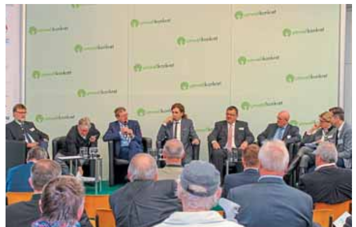
Die Podiumsdiskussion am Freitagnachmittag.