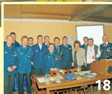
143 Einsätze im Berichtszeitraum 2006