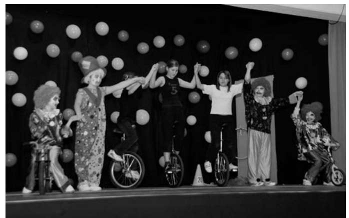
Eine tolle Zirkusnummer wurde den Besuchern von den Schülern geboten.

Damit die in Afrika auch Kinder bekommen. Zum leidigen Thema Körperpflege – der Amtsarzt kommt zum Impfen – fragte ein Schüler zur Freude des Publikums, welchen Arm er waschen müsse, den rechten oder linken. Um den Unterricht endlich zu beenden, stellte ein Schüler der Lehrerin die Aufgabe: Wie viel ist 10 Packen minus 9 Packen? Die Lehrerin antwortete, das ist „Einpacken“, darauf hin stürmten die Schüler freudeschreiend aus dem Klassenzimmer. Die Frage, warum der schlechte Schüler nicht lerne, bis ihm der Kopf rauche, wurde damit beantwortet, dass die Rektorin Eli-