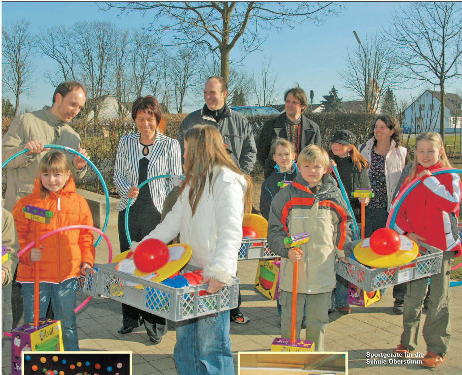
Sportgeräte für die Schule Oberstimm