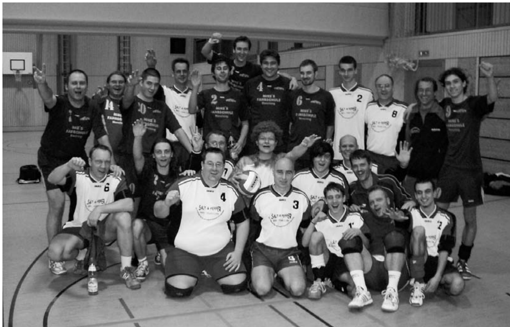
Alle aktiven Volleyballspieler der MBB SG Manching nach dem Derby am 05. Februar in der Mehrzweckhalle im Lindenkreuz.

Zu ihren letzten beiden Spielen trat die zweite Herrenmannschaft in Buxheim an. Dabei konnte die Mannschaft sowohl gegen die Gastgeber des SV Buxheim als auch den noch ungeschlagenen Tabellenführer PSV Ingolstadt keinen Satz gewinnen und beendete die Saison 2006/07 als Tabellenletzter der Kreisliga West. Dagegen setzte sich die erste Herrenmannschaft in Dollnstein zweimal durch. Gegen die gastgebenden Dollnsteiner entwickelte sich eine von beiden Seiten hektisch geführte Partie in der die Manchinger den ersten Satz 25:22 gewannen, den 2. Durchgang nach 21:16-Führung aber noch 24:26 verloren. In den beiden folgenden Sätzen zeigte sich die MBB-Sechs zum Satzende hin konzentrierter und gewann jeweils 25:23. Gegen den VfB Pörnbach konnten die Manchinger dann eine souveräne Leistung abrufen und das Spiel mit 25:16, 25:15 und 25:17 in nur 47 Minuten klar für sich entscheiden.