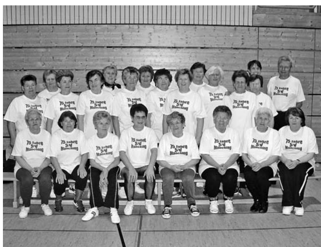
Der Jugend ein Vorbild: 28 Jahre Damengymnastik beim SV Manching

Immobilien Obermeier alles i.O. 85077 Manching, Haydnstr. 8, Tel. (0 84 59) 74 11, Fax 3 02 75