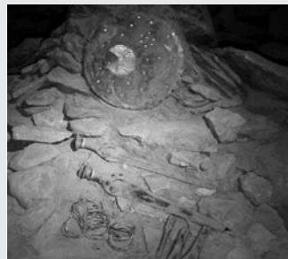
Fund von Nebra (ca. 1600 vor Christus)