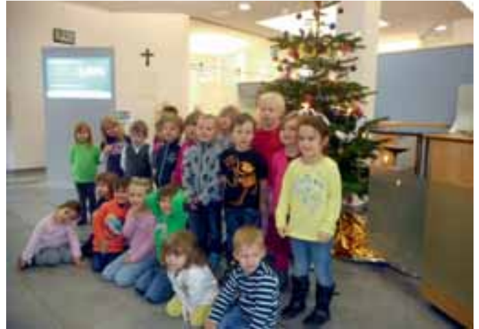
Markt Manching (TrA)

In diesem Jahr durften die Kolbe der Kita Schatzkiste den Weihnachtsbaum in der Hallertauer Volksbank schmücken. Eine sehr wichtige Aufgabe für die Kinder. Aber im Vorfeld mussten wir uns erst einmal überlegen, was wir für Baumschmuck basteln wollen. Es entstanden Christbaumkugeln, die mit Transparentpapier beklebt wurden, Sterne aus Papier, ausgestochene Salzteigfiguren und