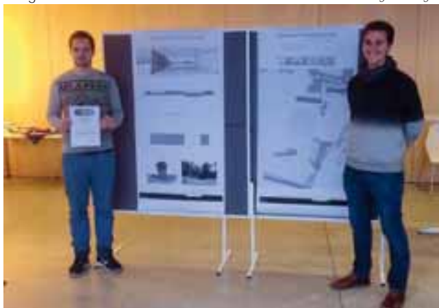
Das erstplatzierte Studententeam mit seiner prämierten Projektarbeit.