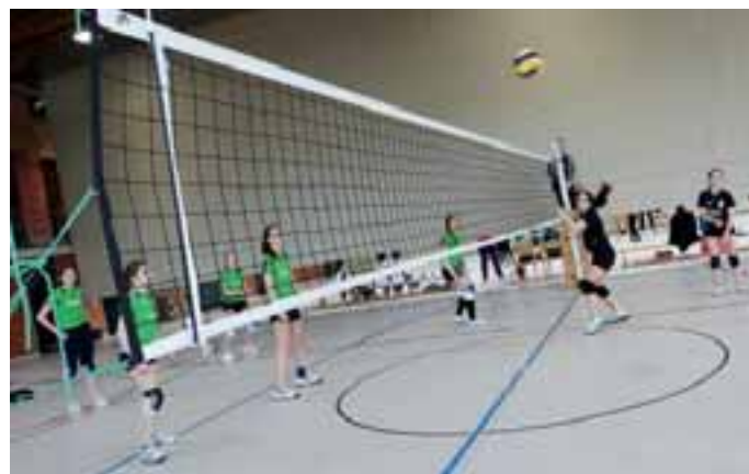
Spielszene der MBB-Volleyballerinnen gegen den MTV Pfaffenhofen.