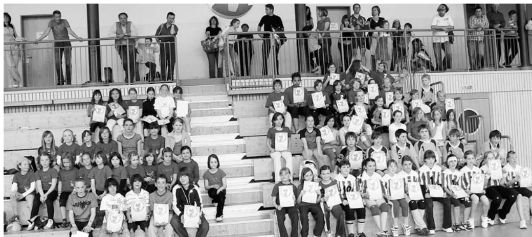
Alle Teilnehmer des Abschlussturniers nach der Siegerehrung auf der Tribüne der Manchinger Mehrzweckhalle