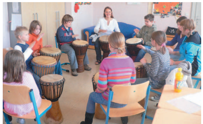
Sechsstündiger Schnuppertrommelkurs für Kinder ab 10 Jahren Ihr Können präsentieren die Kinder am Spielplatz- und am Schulfest in Oberstimm.