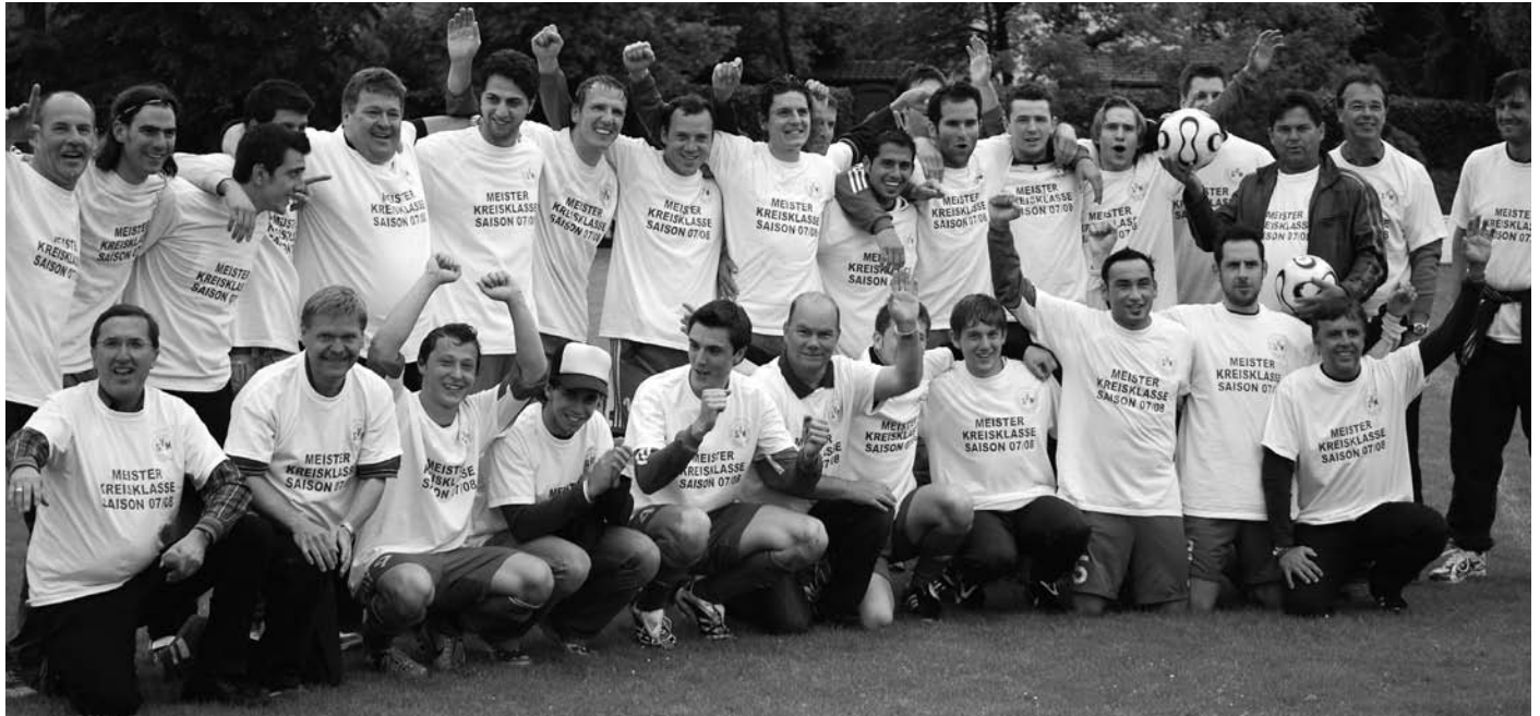
Große Freude beim SV Manching. Nach drei Jahren steigt die Erste wieder in die Kreisliga auf. Das Bild zeigt Mannschaft, Trainer, Betreuer und Funktionäre des neuen Kreisligisten.

Riesengroß war die Freude von Spielern, Trainern und Funktionären, als der SVM nach dem 4:1 (0:0)- Sieg über den MTV Pfaffenhofen die vorzeitige Meisterschaft erringen konnte. Die Mannschaft steigt damit nach dreijähriger Abwesenheit wieder in die Kreisliga auf.