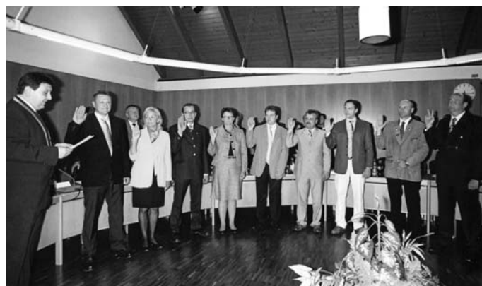
Vereidigung der 9 neuen Marktgemeinderäte