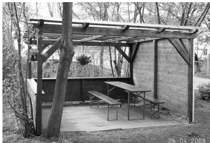
Der renovierte Holzpavillon nach Abschluss der Arbeiten.