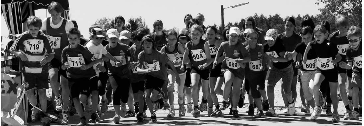
Start zum Schülerlauf mit 35 Teilnehmern