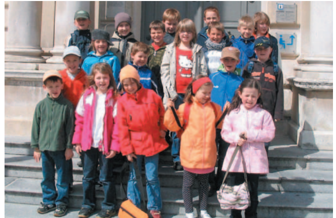
Kinderstadtführung der Stadt Ingolstadt