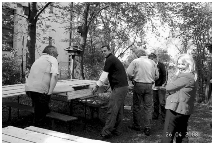
Mitarbeiter des CIT aus Ingolstadt im Garten der Manchinger Tafel