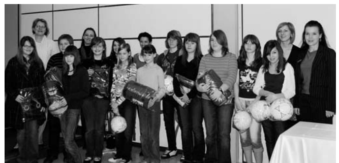
Realschule am Keltenwall