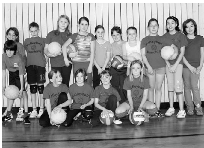
Die Spieler der MBB SG Manching beim Turnier in Stammham