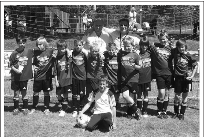
Die E1- Junioren des SV holten sich souverän den Turniersieg beim diesjährigen Pfingstturnier.