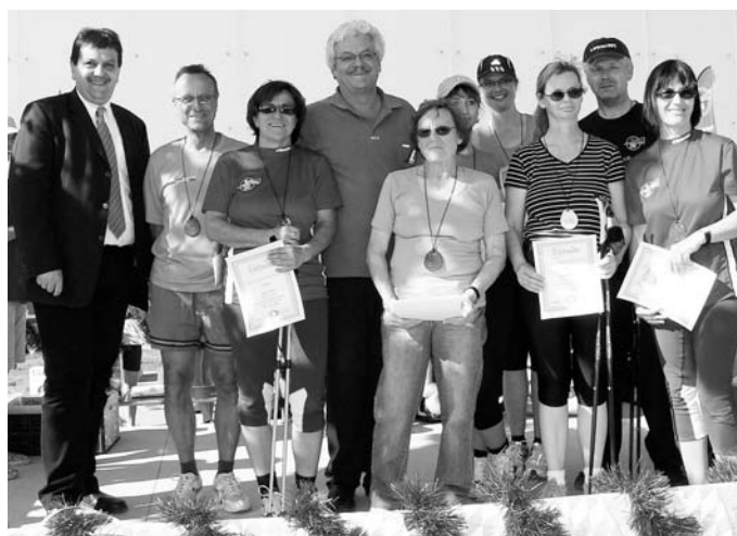
Aktive Nordic Walker der MBB SG Manching bei der Siegerehrung zum 3. Manchinger Museumslauf vom 10. Mai 2008

Der Kurs umfasst bis zu den Sommerferien somit sechs ein-