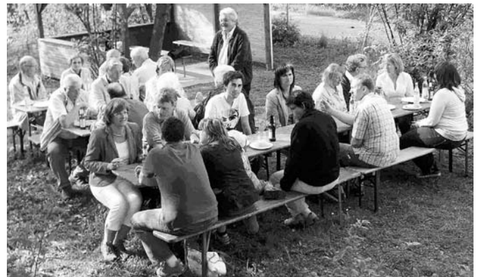
3. Mai: Gemütliches Beisammensein der Museumsbesucher im Garten der MBB Geschäftsstelle