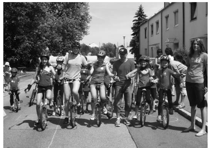
Startaufstellung einer Einradgruppe zum Rennen 2007