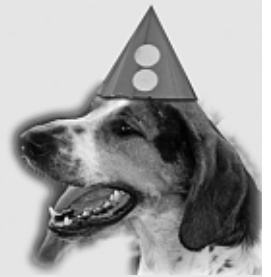
Auf Euer Kommen freut sich Die Vorstandschaft

Die Eigentümer jagdbarer Grundstücke der Gemarkungen Manching und Niederstimm sind dazu recht herzlich eingeladen.