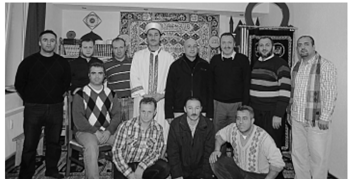
Viele Aufgaben warten auf die neugewählte türkische Vorstandschaft in Manching.