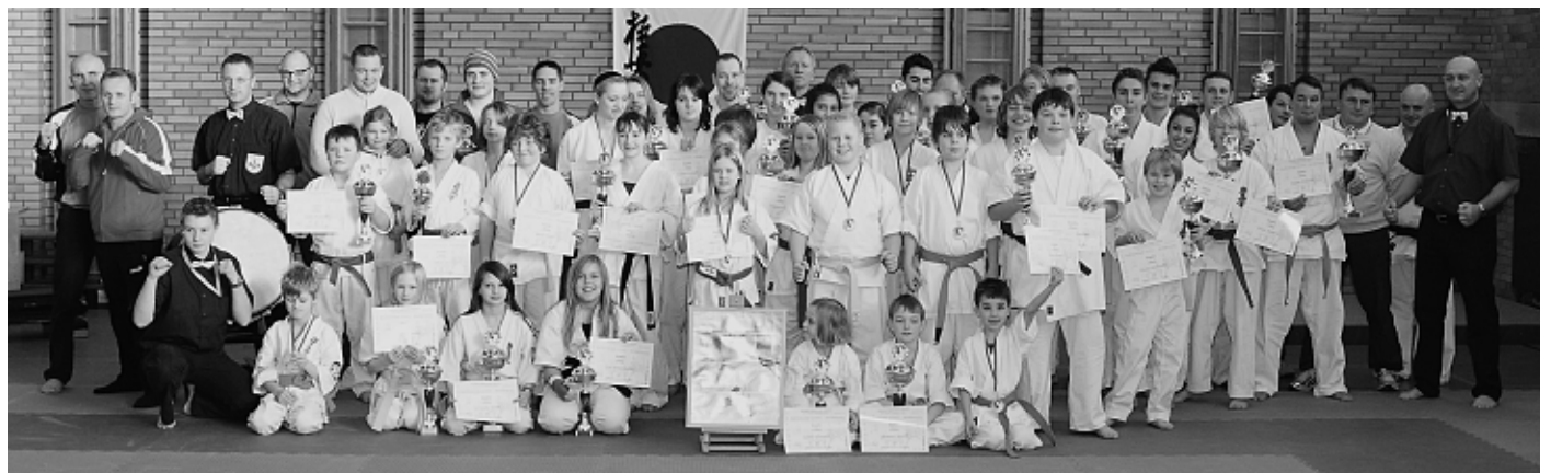
Alle Teilnehmer am Kelten-Cup 2010 aus Pfaffenhofen, Baar/Ebenhausen und Oberstimm.

Kinder: Dienstag und Donnerstag, 17.00 – 18.30 Uhr, Erwachsene: 18.30 – 20.00 Uhr.