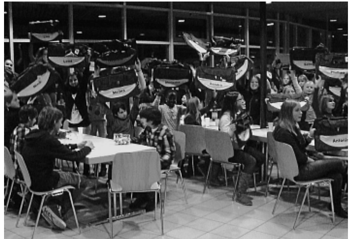
Die Volleyballjugend mit ihren neuen Taschen.

Wir bedanken uns bei unseren Ingolstädter Sponsoren: Chinarestaurant Panda, Friseursalon Delicut und bei den Manchinger Sponsoren: Apotheke im Medi-Center, Bergsteiner GmbH, Brennstoffe Finkenzeller, Der Blumenladen, Eva's Haarstudio, Fahrschule Baching, Friseursalon Tragl, La Cassetta, Nerb