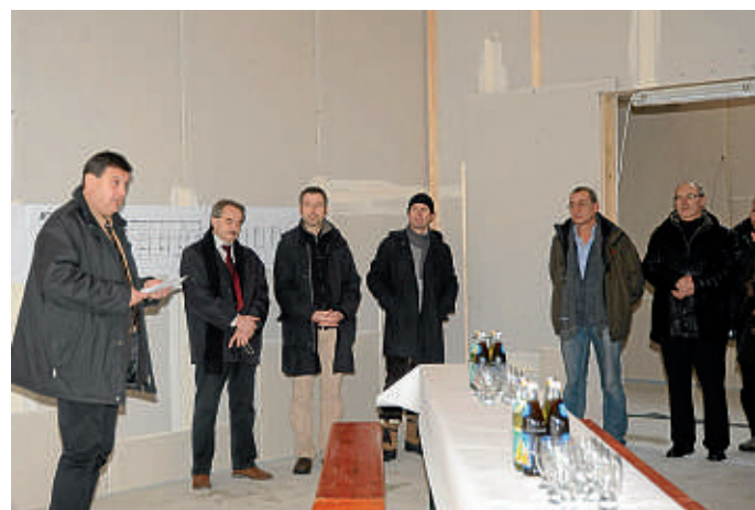
Vor geladenen Gästen wurde die Rohaufertigungstellung der neuen Kindertagesstätte im Altenfeld besichtigt und gefeiert.