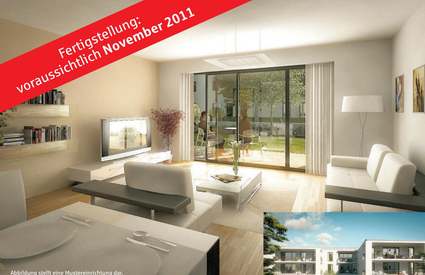
Abbildung stellt eine Mustereinrichtung dar.

Fertigstellung: voraussichtlich November 2011