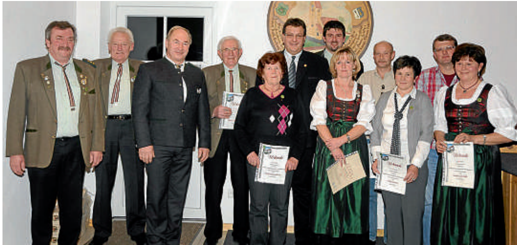
In geselliger Runde ehrten die Immergrün-Schützen aus Westenhausen zur 60jährigen Gründung zahlreiche Mitglieder.

Dass ein Gründungsfest auch ohne große Grußworte und Ansprachen über die Bühne gehen kann, das bewiesen die Immergrün-Schützen aus Westenhausen. Der Verein feierte in einer angenehmen Atmosphäre in seinem Vereinsheim sein 60-jähriges Bestehens.