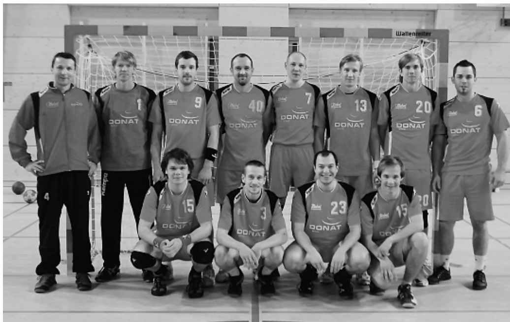
Die 1. Herrenmannschaft der MBB SG Manching.

Die weibliche A-Jugend belegt, nicht ganz überraschend, den ersten Tabellenplatz. Mit 10:0 Punkten führen sie überlegen die Liga an und treffen am 29.01.2011 auf den Tabellenzweiten, den TSV Taufkirchen. Ein richtungsweisendes