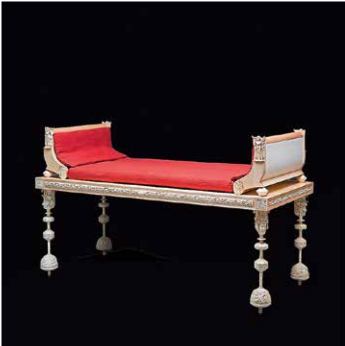
Rekonstruierte Kline aus der römischen Nekropole von Haltern am See.