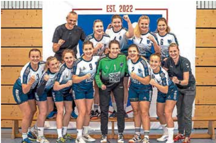
Grund zum Jubeln: die 1. Damenmannschaft steht weiterhin ungeschlagen auf dem 1. Tabellenplatz der Bezirksoberliga.

Die 1. Damenmannschaft des HC Donau/Paar musste sich im Spitzenspiel gegen den TV Altötting mit einem Remis zufrieden geben. Beim 29:29 gaben die Damen damit ihren ersten Punkt der Saison her, thronen dennoch weiterhin auf dem 1. Tabellenplatz der Bezirksoberliga.