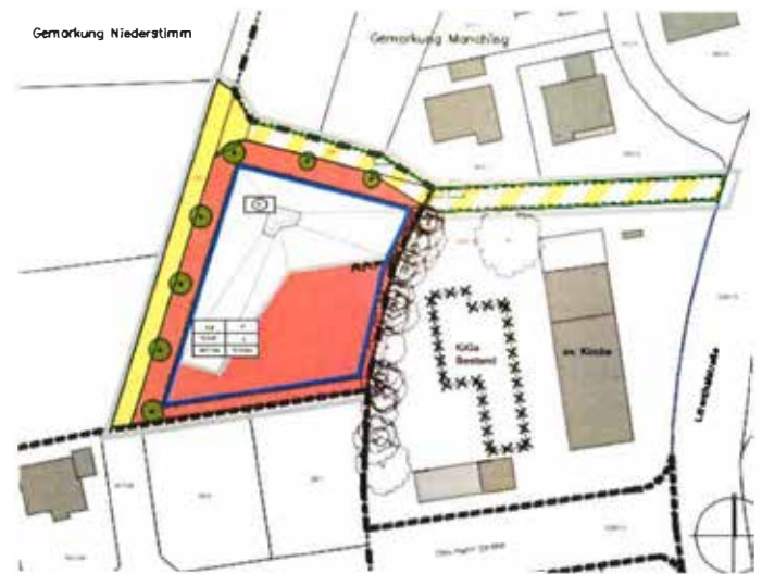
Lageplan zur 9. Änderung des Bebauungsplanes Nr. 60 „Am Anger“