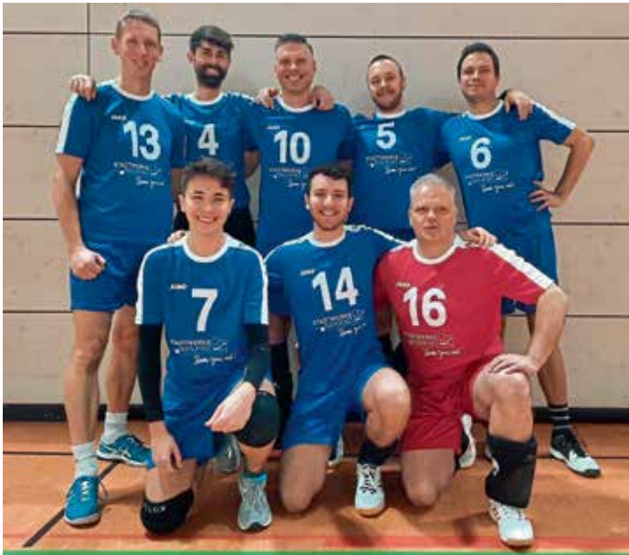
MBB-Herren beim Spieltag in Neuburg