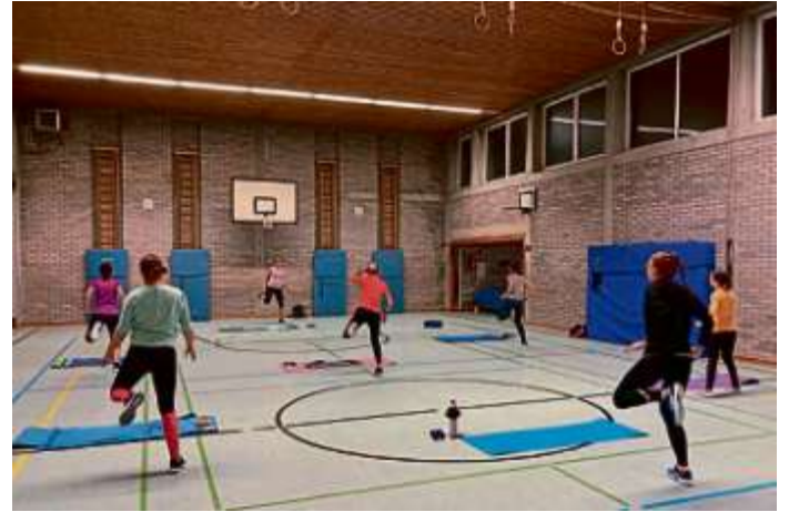
Teilnehmer der Bauch-Beine-Po-Stunde in der Donauefeldhalle