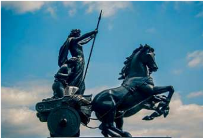
Denkmal für die keltische Heerführerin Boudicca von Thomas Thornycroft in London aus dem Jahr 1902.