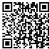
Markt Manching (FoM)

noch mehr Menschen für den öffentlichen Nahverkehr begeistert werden. Mit der Einführung des Tickets im VGI steht nun in allen größeren bayerischen Verkehrsverbänden ein vergleichbarer Tarif für Schülerinnen, Schüler und Auszubildende zur Verfügung. Schon jetzt nutzen laut dem Bayerischen Verkehrsministerium fast eine Million junge Menschen in Bayern das Ticket.