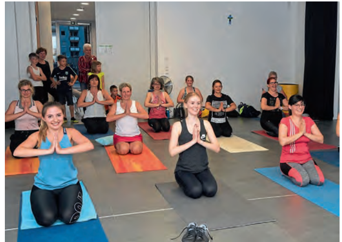
Viel Spaß bereitete die Nacht des Sportes den Frauen.