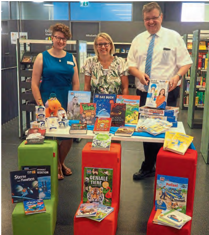
Markt Manching (FrM1)

Zum wiederholten Male darf sich die Bibliothek Markt Manching über eine Spende von AmiciO, dem Verein für Kinder- und Jugendförderung freuen. Für den Betrag von 500,- € konnte ein Schwung der begehrten Tonie-Figuren, Tiptoi-Medien samt neuem Tiptoi CREATE-Stift sowie ein ganzer Stapel neuer Kinder- und Jugendbücher angeschafft werden. Neben den Bibliotheksnutzern dürfen sich auch die Kindergar-