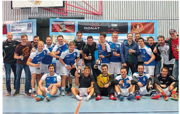
Die Herrenmannschaft feierte gebührend den Aufstieg in die Bezirksliga in der Saison 2018/19.