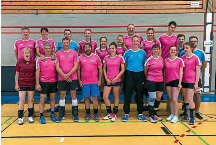
Alle Teilnehmer der MBB-SG Manching am GSG-Turnier in Stade