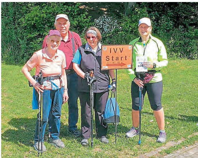
Teilnehmer der MBB-SG am Volkswandertag in Lenting