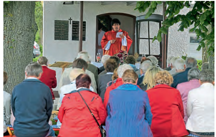
Zahlreiche Gläubige nutzen am Pfingstmontag die Gelegenheit zu einem Gottesdienst unter freiem Himmel in Forstwiesen.