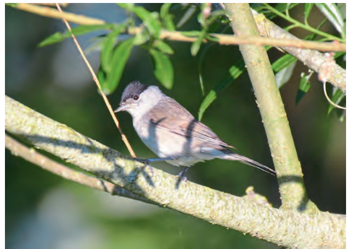
Eine Mönchsgrasmücke beobachtet den fotografischen Eindringling.