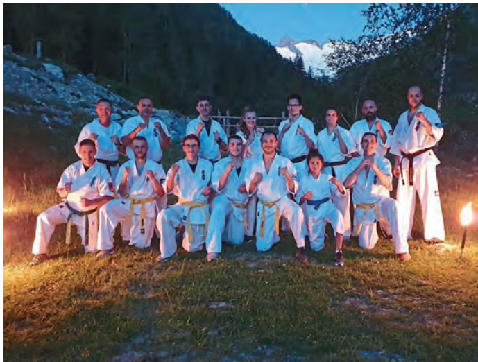
Training in der Dämmerung