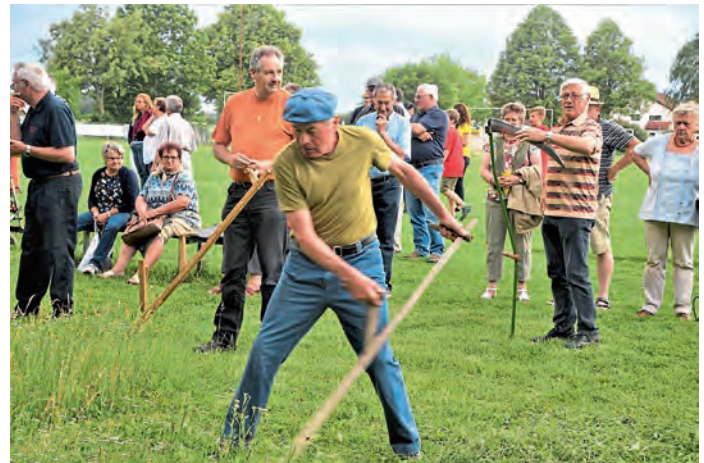
Auf dem Bild ist die Siegermannschaft beim diesjährigen Sensenmähwettbewerb in Pichl zu sehen.