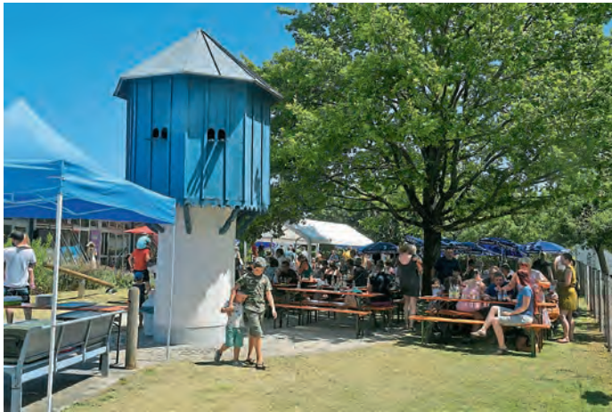
Mit einem bunten Programm feierten Kinder, Eltern und Ehren-gäste das 25 jährige Bestehens des Pichler Kindergartens.