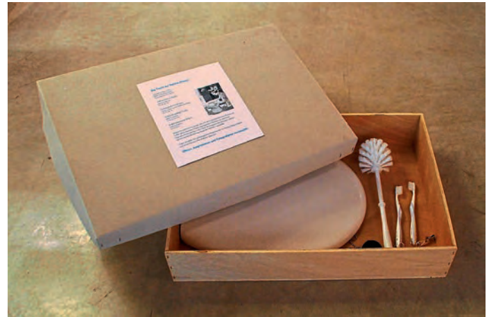
Mitmach-Station in der Studioausstellung.

Die Ausstellung gibt zudem einen Überblick über Macaulays publizistisches Œuvre, für das er mehrfach ausgezeichnet wurde, unter anderem mit dem Deutschen Jugendliteraturpreis. Den Schwerpunkt bildet seine Grafik-Novelle „Motel der Mysterien“, die augenzwinkernd die Altertumswissenschaften auf die Schippe nimmt: Der Hobby-Archäologe Howard Carson entdeckt im Jahr 4022 nach (!) Christus eine vermeintliche Kult- und Grabstätte der untergegangenen Yankee-Kultur. Carson kann sein Glück kaum fassen, als er auf ein ungestörtes Grab stößt, das noch mit einem „Do not disturb“-Siegel verschlossen ist. Schritt für