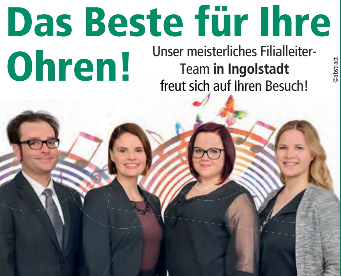
(Markt Manching (KnS))

IN, Am Westpark 1 (Medi-IN)* ☎ 0841 9517110 MIT KINDER HÖRZENTRUM IN, Münchener Str. 143* ☎ 0841 12605083 IN, Schulstr. 26 (im Theresiencenter), ☎ 0841 9932025